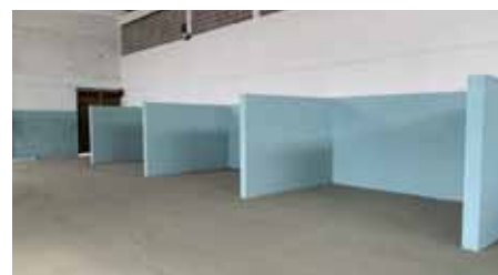
Galpão fica na avenida Mauro Miranda Madureira; expectativa é de que seja inaugurado em breve

geração de renda para 11 famílias. Ainda que todo o suporte seja dado nesse período de inatividade – tanto pela Prefeitura, quanto pelos governos estadual e federal – é muito importante para os catadores a retomada do exercício de seu ofício”, destaca o prefeito Victor Coelho, que realizou visita técnica no novo galpão, nesta segunda-feira (31).