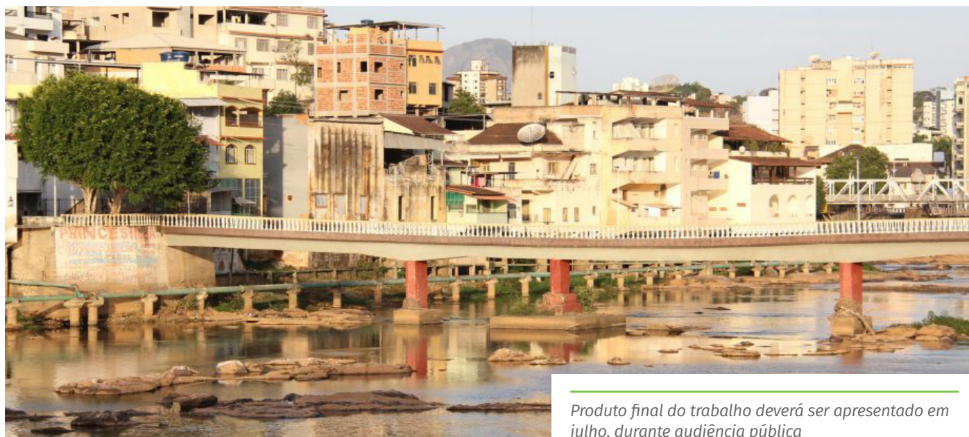
Produto final do trabalho deverá ser apresentado em julho, durante audiência pública