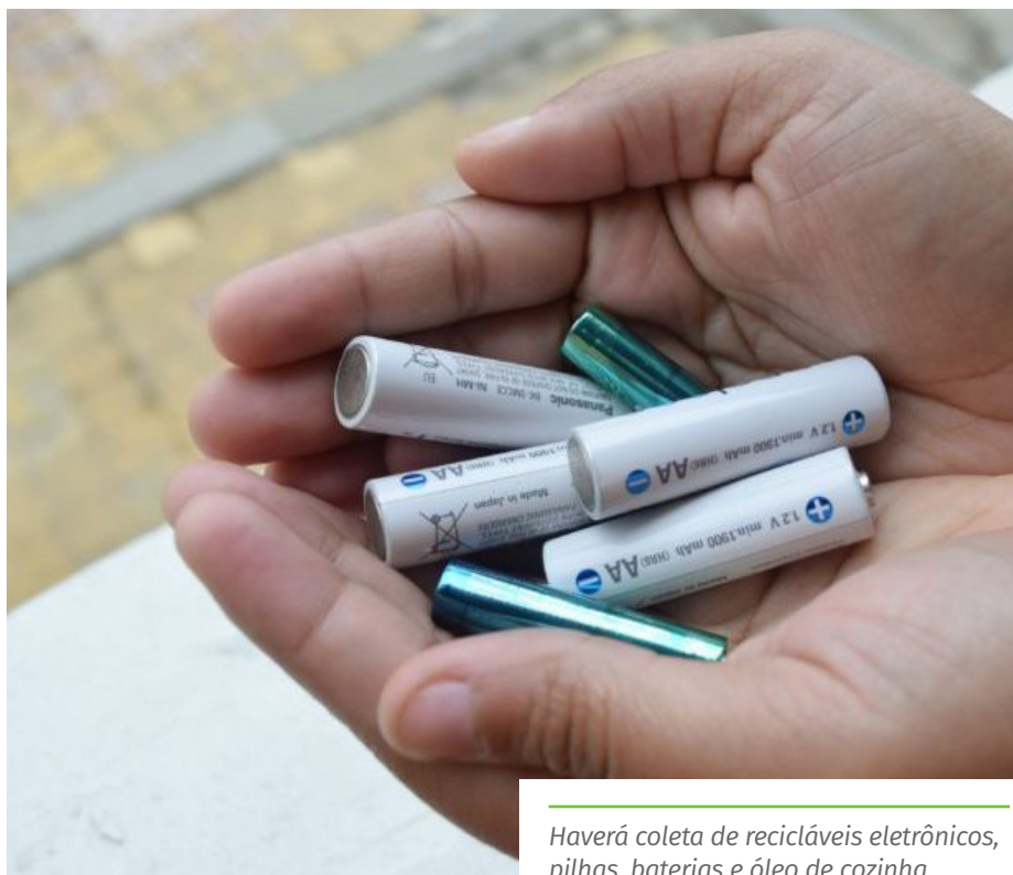
Haverá coleta de recicláveis eletrônicos, pilhas, baterias e óleo de cozinha