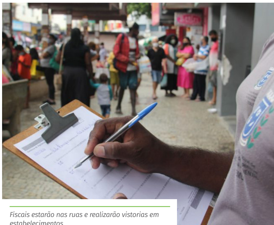
Fiscais estarão nas ruas e realizarão vistorias em estabelecimentos

passado, e decidimos estabelecer a multa devido ao grande número de pessoas desrespeitando a regra. Não é desejo da Prefeitura punir ninguém, e esperamos que a população colabore. A pandemia alcançou um patamar de muita gravidade, e é necessário a contribuição de todos”, afirma o vice-prefeito de Cachoeiro, Ruy Guedes, que coordena o Sistema de Comando Operacional (SCO) para combate à Covid-19 do município.