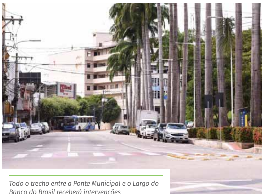
Todo o trecho entre a Ponte Municipal e o Largo do Banco do Brasil receberá intervenções