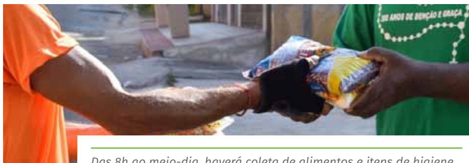
Das 8h ao meio-dia, haverá coleta de alimentos e itens de higiene

O “Viva Mais Solidário” faz parte da campanha “Compartilhe Amor”, das secretarias municipais de Desenvolvimento Social e de Saúde, que tem pontos de coleta de alimentos, álcool em gel e sabão nas Unidades Básicas de Saúde (UBS) e nos supermercados Perim de Cachoeiro.