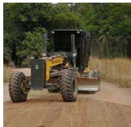
Serviço melhora condições de escoamento da produção e ajuda no turismo rural

no distrito de Gironda, na comunidade rural de Moitãozinho e no distrito industrial de São Joaquim.