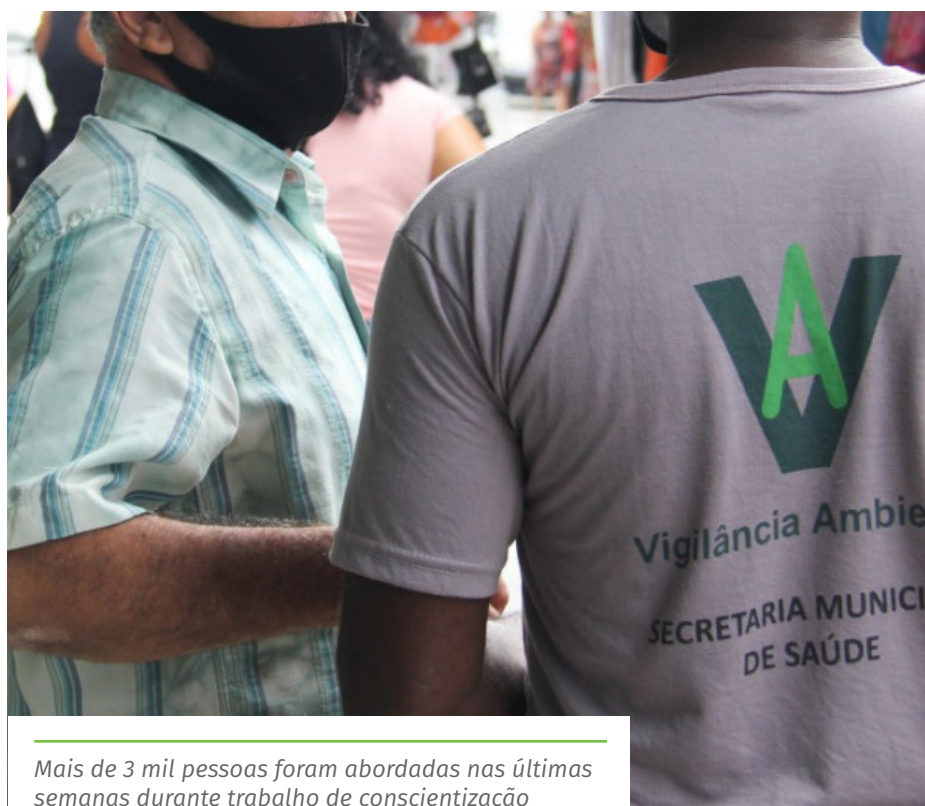
Mais de 3 mil pessoas foram abordadas nas últimas semanas durante trabalho de conscientização

básicas. Por isso, reforçamos o apelo para que todos tomem consciência da gravidade da situação e sigam as regras”, afirma o vice-prefeito de Cachoeiro, Ruy Guedes, que coordena o Sistema de Comando Operacional (SCO) para combate à Covid-19 do município.