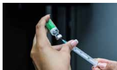
Devem se cadastrar os que não tomaram a primeira dose da vacina