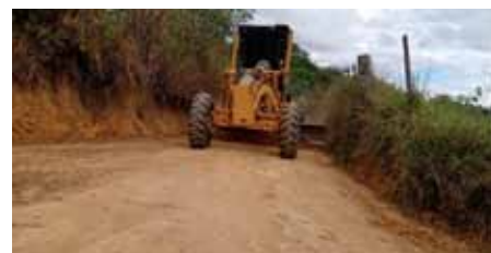
Os trabalhos foram realizados pela Secretaria Municipal de Interior

Nesta semana, a Secretaria de Interior dará continuidade aos serviços nas estradas das localidades de Soturno, Sambra e Gironda.