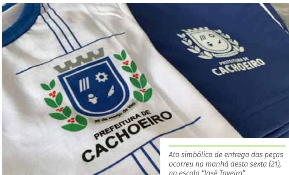
Ato simbólico de entrega das peças ocorreu na manhã desta sexta (21), na escola “José Taveira”