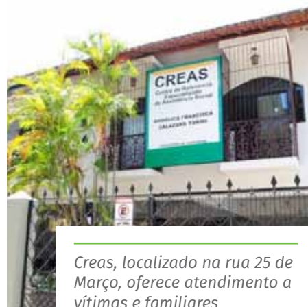
Creas, localizado na rua 25 de Março, oferece atendimento a vítimas e familiares

Confira os canais de atendimento, no link: www.cachoeiro.es.gov.br/noticias