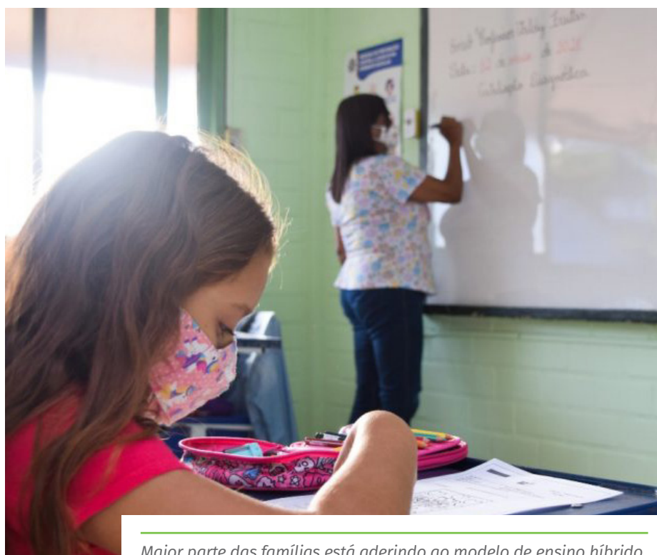
Maior parte das famílias está aderindo ao modelo de ensino híbrido

No caso de estudantes que não possuem acesso à internet, os pais e responsáveis podem entrar em contato com as escolas para retirar o material impresso diretamente nas unidades.