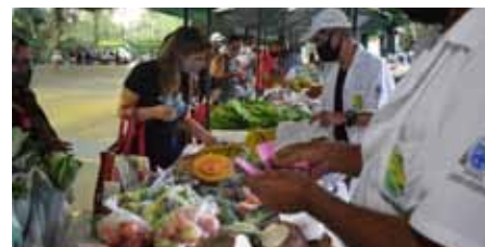
Feira ocorre todas as terças e sextas, das 17h às 19h, no Pavilhão da Ilha da Luz

Bairro Nova Brasília – Próximo ao ginásio municipal – a partir das 5h.