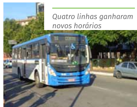
Quatro linhas ganharam novos horários

A Agersa ressalta também que, para registrar reclamações sobre o serviço de transporte, o requerente pode entrar em contato com a Ouvidoria da autarquia pelo telefone 0800 283 4048, por meio do aplicativo “Todos Juntos”, da Prefeitura, ou pelo site www.agersa.es.gov.br .