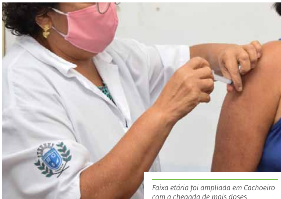
Faixa etária foi ampliada em Cachoeiro com a chegada de mais doses

Confira os contatos das Unidades Básicas de Saúde completa, no link: www.cachoeiro.es.gov.br/noticias .