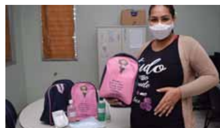
Os kits são entregues às que comparecem, frequentemente, às consultas de pré-natal

“A atenção primária à saúde prevê a promoção da saúde e prevenção de doenças, por isso, o kit distribuído é importante. Vem para intensificar o combate à pandemia, além de promover a conscientização das gestantes”, avalia o secretário municipal de Saúde, Alex Wingler.