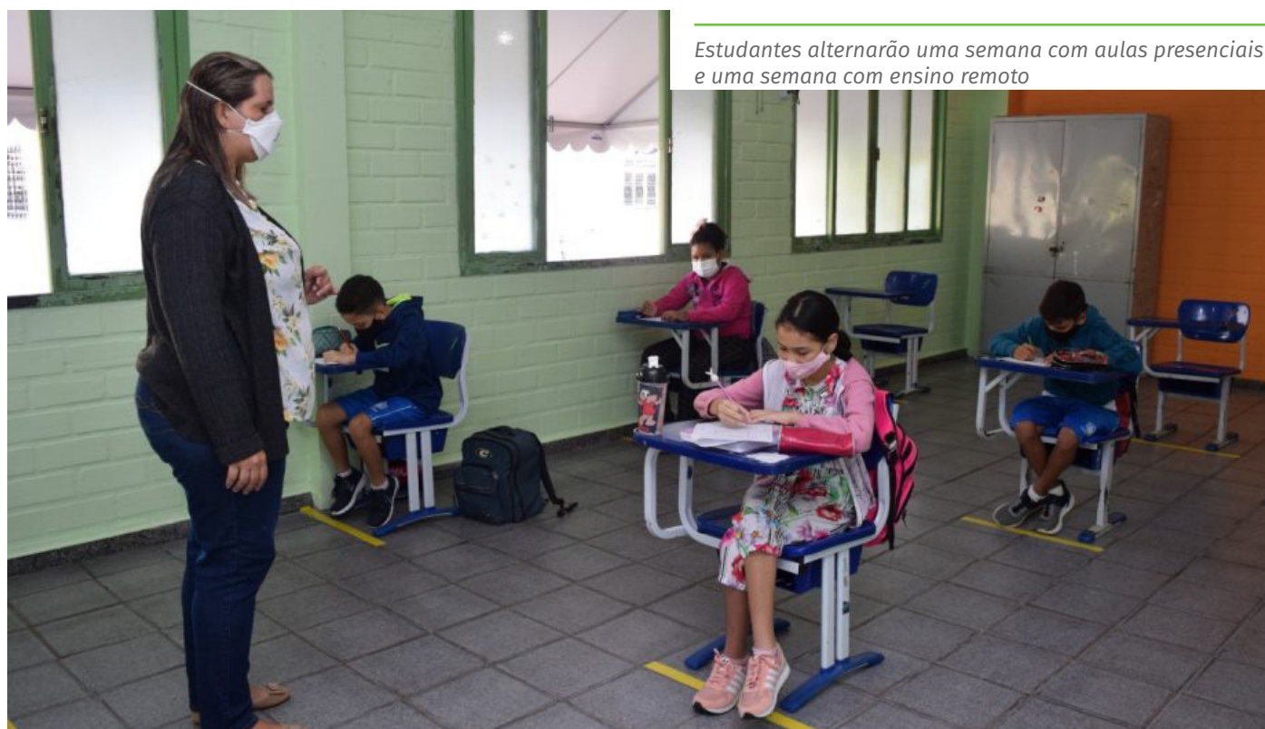
Estudantes alternarão uma semana com aulas presenciais e uma semana com ensino remoto

Confira o calendário de retorno às aulas completo, no link: www.cachoeiro.es.gov/noticias