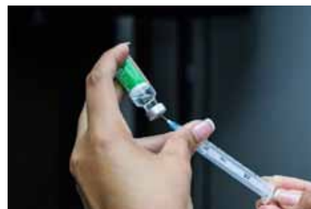
Interrupção é para o imunizante da Fiocruz, seguindo orientação do Ministério da Saúde

“Novamente, destacamos que esse procedimento é por precaução. Considerando as condições de risco para essas mulheres por conta da gestação, é preciso redobrar os cuidados”, explica o secretário municipal de Saúde.