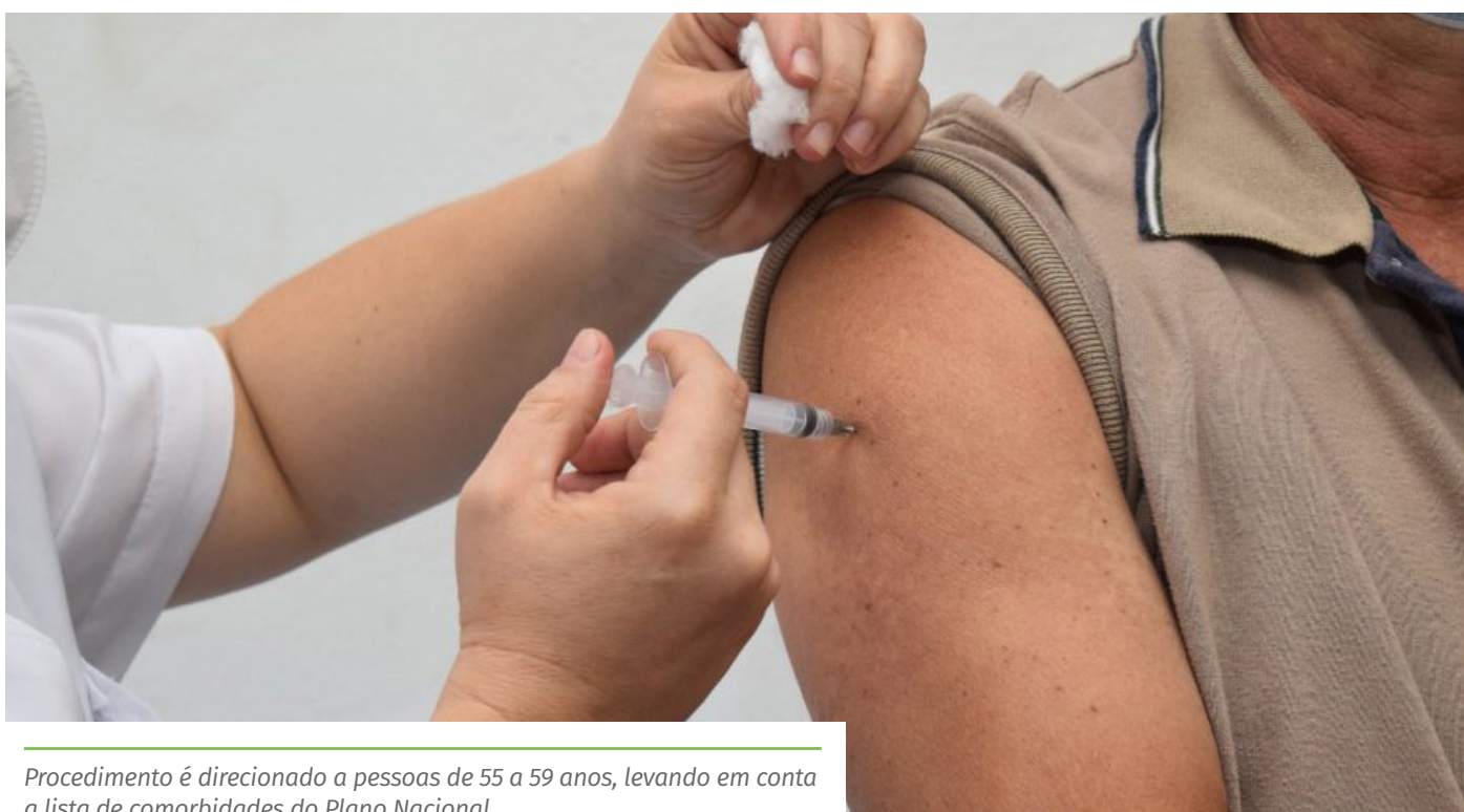
Procedimento é direcionado a pessoas de 55 a 59 anos, levando em conta a lista de comorbidades do Plano Nacional

– Para vacinar pessoas com deficiência permanente, de 55 a 59 anos, cadastradas no Programa de Benefício de Prestação Continuada (BPC), será considerado o cadastro do programa e levantamento junto à Secretaria Municipal de Desenvolvimento Social (Semdes).