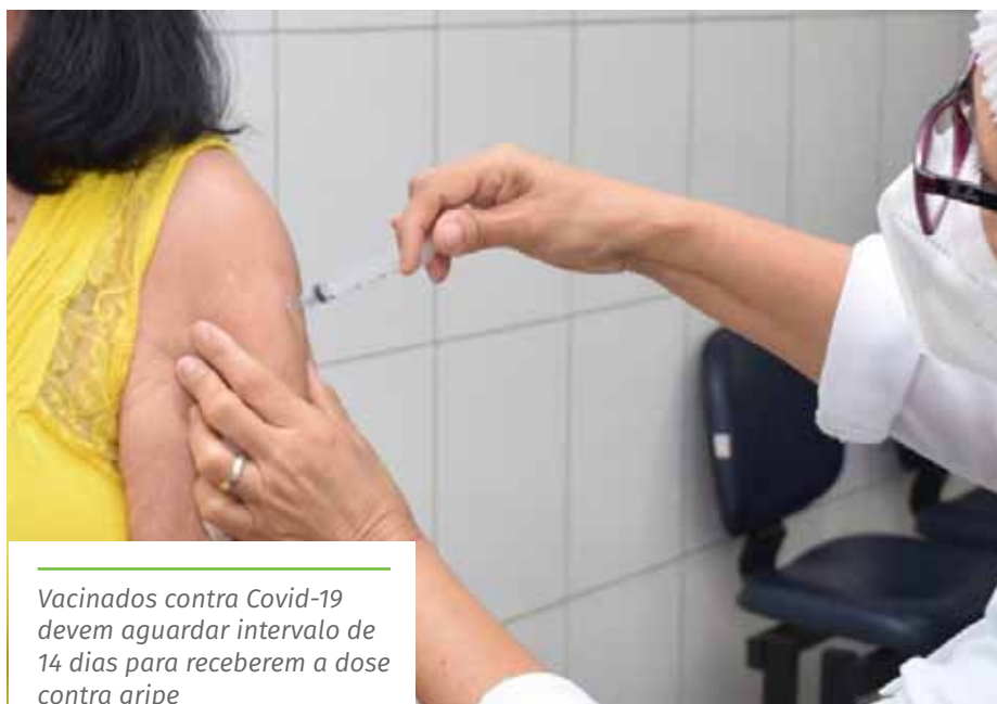
Vacinados contra Covid-19 devem aguardar intervalo de 14 dias para receberem a dose contra gripe

Cachoeiro pretende atingir a meta de 90% em todos os públicos. No caso das crianças de seis meses a menores de seis anos, enfermeiros das unidades básicas de saúde fazem busca ativa, entrando em contato com as mães para pedir que levem os filhos para tomar o imunizante.