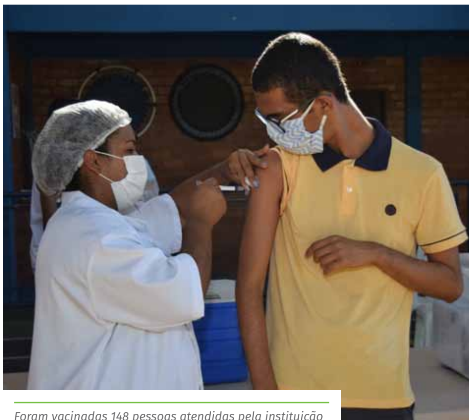
Foram vacinadas 148 pessoas atendidas pela instituição

Confira os Contatos das Unidades Básicas de Saúde, pelo portal: www.cachoeiro.es.gov.br/noticias