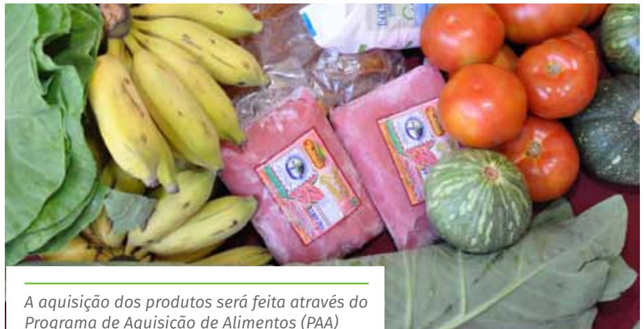
A aquisição dos produtos será feita através do Programa de Aquisição de Alimentos (PAA)

O edital da chamada pública, com a documentação a ser preenchida, pode ser acessado na página principal do site da Prefeitura de Cachoeiro ( www.cachoeiro.es.gov.br ), clicando no banner da ação. Mais informações podem ser obtidas pelo telefone (28) 3155-5301.