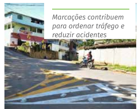
Marcações contribuem para ordenar tráfego e reduzir acidentes

bairros Independência, Santo Antônio, Paraíso, São Geraldo, IBC, Monte Cristo, BNH, Coramara e Aeroporto. Nesses lugares, o trabalho foi direcionado, principalmente, para áreas próximas a escolas. As ações acontecem sempre no período noturno, para evitar problemas de fluidez no trânsito durante o horário comercial.