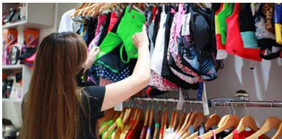
Recomendações ajudam consumidores na tarefa de escolher o presente das mães

Confira mais dicas no portal: www.cachoeiro.es.gov.br/noticias