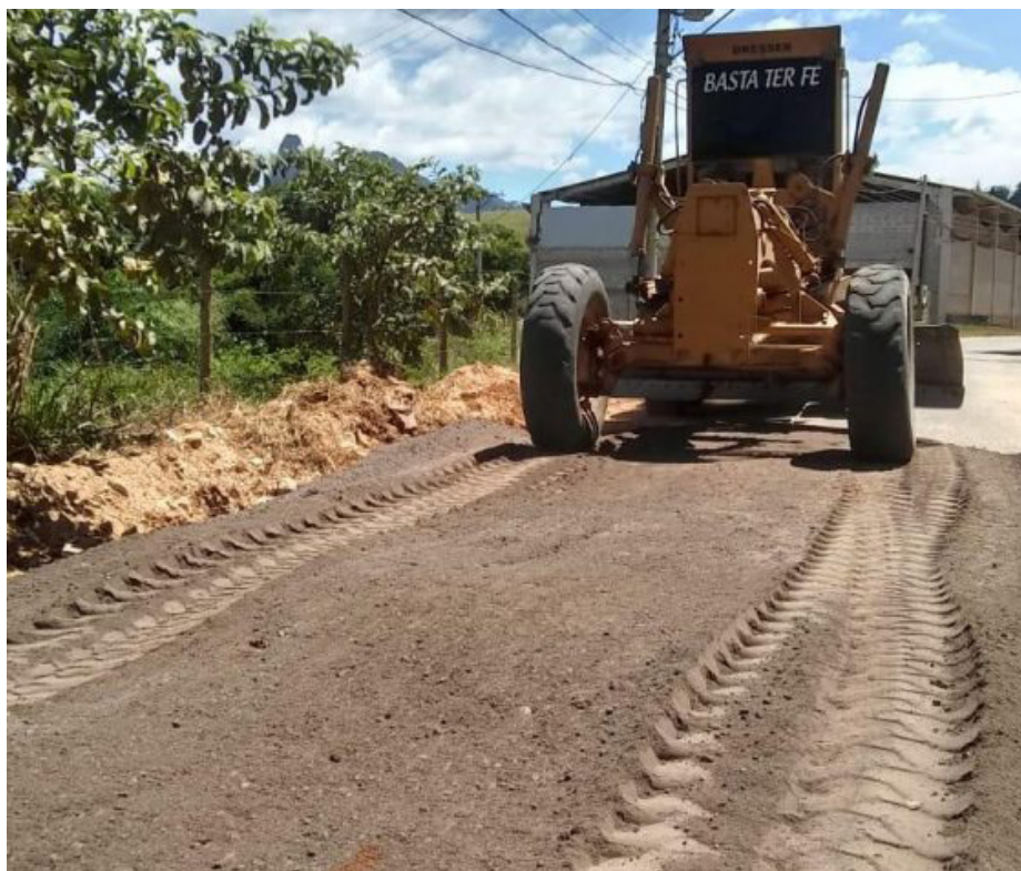
Trecho ganhará revestimento com Revsol, material sustentável

Nesta semana, o trecho pavimentado da estrada de São Joaquim recebeu uma operação tapa-buraco, coordenada pela Secretaria Municipal de Manutenção e Serviços.