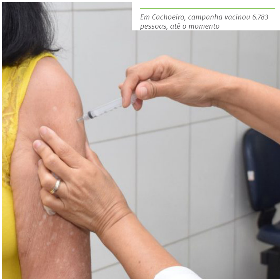
Em Cachoeiro, campanha vacinou 6.783 pessoas, até o momento

UBS Conduru UBS Itaoca UBS Soturno UBS Burarama UBS Córrego dos Monos