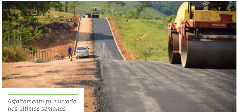
Asfaltamento foi iniciado nas últimas semanas

algumas vias que mais necessitavam. Durante a semana, também serão contemplados, com as intervenções, a avenida Jones dos Santos Neves (em frente ao Café Campeão) e o acesso ao distrito industrial de São Joaquim, além de ruas nos bairros Centro e Nova Brasília. O trabalho é executado pela Secretaria Municipal de Manutenção e Serviços (Semmat).