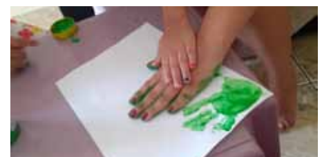
Ações são voltadas a crianças de 0 a 6 anos de famílias beneficiárias de programas sociais

Desenvolvido em Cachoeiro desde 2017, o “Criança Feliz Capixaba” inclui, ainda, ações de acompanhamento de gestantes, que também estão sendo realizadas de forma remota, em função da necessidade de distanciamento social decorrente da pandemia.