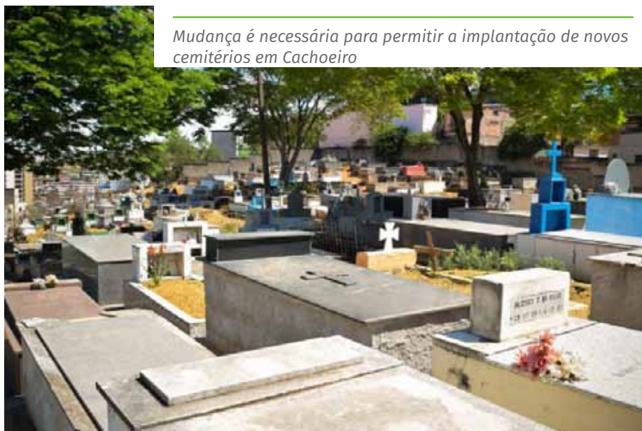
Mudança é necessária para permitir a implantação de novos cemitérios em Cachoeiro

De acordo com a Secretaria Municipal de Urbanismo, Mobilidade e Cidade Inteligente (Semurb), a área em Itaoca reúne condições apropriadas para implantação de um cemitério – como a localização em região pouco adensada – e atende às exigências da legislação ambiental e urbanística.