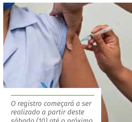
O registro começará a ser realizado a partir deste sábado (10) até o próximo

contrato de trabalho; carteira de trabalho; carteira do conselho da categoria mais declaração do serviço onde atua ou alvará de funcionamento ou declaração do Imposto de Renda, para os profissionais autônomos.