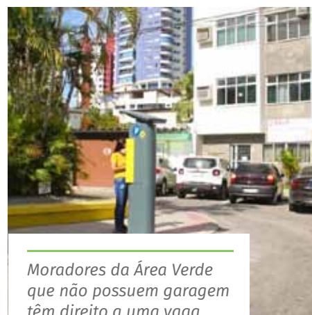
Moradores da Área Verde que não possuem garagem têm direito a uma vaga

A cobrança foi suspensa no período de quarentena, para proteger a saúde da população em geral e a dos colaboradores da empresa concessionária. O sistema está sujeito a novas alterações no funcionamento, de acordo com a classificação de risco estabelecida pelo governo estadual semanalmente.