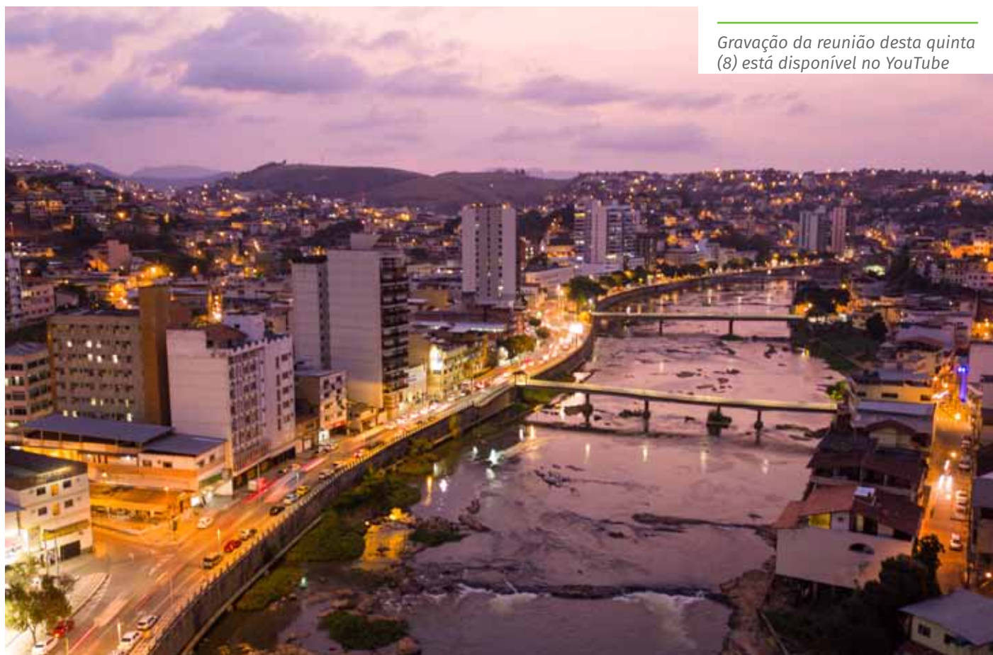
Gravação da reunião desta quinta (8) está disponível no YouTube

São atribuições dos conselheiros: acompanhar a implementação do Plano Diretor, analisando e deliberando sobre questões relativas à sua aplicação; analisar, propor e aprovar eventuais alterações do Plano; aprovar e acompanhar a execução de planos e projetos de interesse do desenvolvimento urbano e rural, dentre outras.