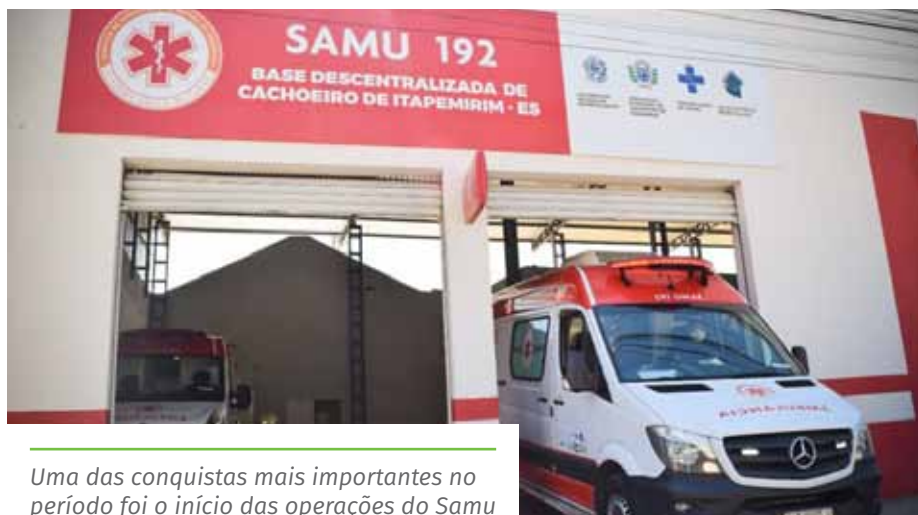
Uma das conquistas mais importantes no período foi o início das operações do Samu

Nos primeiros meses de 2021, foram distribuídas mais de 2,4 mil cestas de alimentos a famílias em situação de vulnerabilidade social, cadastradas nos Centros de Referência de Assistência Social. Para reforçar as ações de segurança alimentar no período da pandemia, foi lançada a campanha “Compartilhe Amor”, que incentiva as pessoas que estão sendo vacinadas contra a Covid-19 a fazerem a doação de 1 kg de alimento, álcool em gel ou sabão, no ato da imunização.