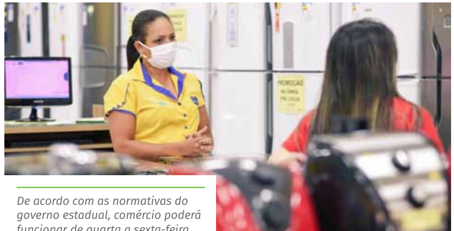
De acordo com as normativas do governo estadual, comércio poderá funcionar de quarta a sexta-feira

Denúncias de desrespeito às normas restritivas podem ser feitas junto ao Disk Aglomeração, que funciona 24 horas. O contato pode ser feito pelo telefone 153, pelo site www.cachoeiro.es.gov.br/ouvidoriageral ou pelo aplicativo de celular “Todos Juntos”.