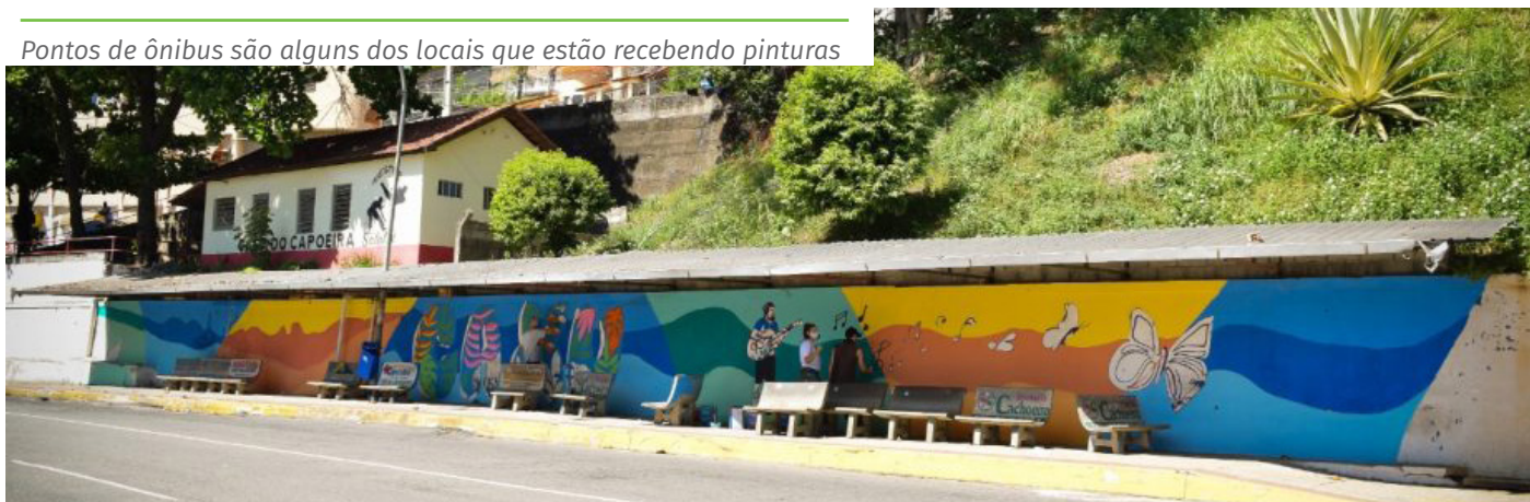
Pontos de ônibus são alguns dos locais que estão recebendo pinturas

Outro ponto que em breve vai virar tela para artistas locais é a ponte de pedestres Governador João Bley, que liga a avenida Beira Rio ao bairro Aquidaban.