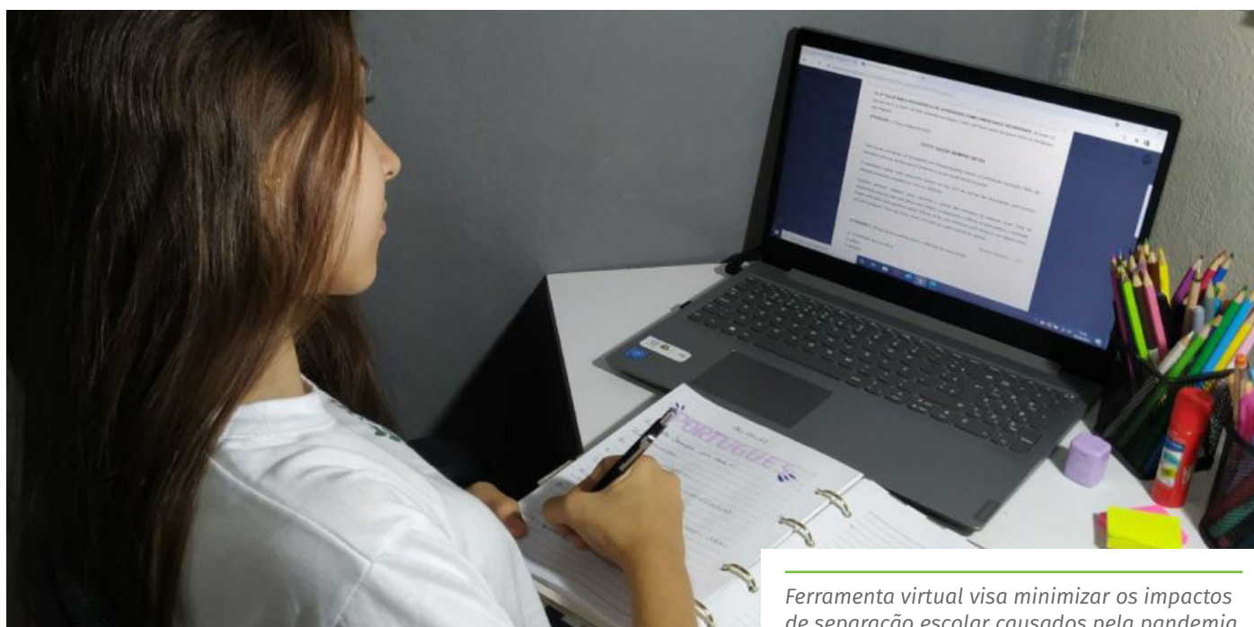
Ferramenta virtual visa minimizar os impactos de separação escolar causados pela pandemia

No site da prefeitura de Cachoeiro ( www.cachoeiro.es.gov.br ), na área da Secretaria de Educação, pode ser acessado o Portal Seme, um espaço on-line onde estão disponíveis os links para o Google Sala de Aula, o Portal do Aluno, o canal de YouTube da Seme, o formulário para dúvidas de professores e de estudantes, além dos manuais de orientação para uso das plataformas.