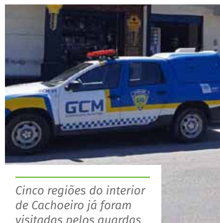
Cinco regiões do interior de Cachoeiro já foram visitadas pelos guardas

estejam descumprindo as determinações da quarentena, por meio do Disk Aglomeração (153).