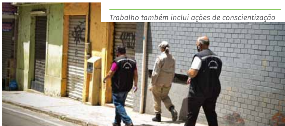
Trabalho também inclui ações de conscientização

Para denúncias, o Disk Aglomeração realiza atendimentos 24 horas. Os cidadãos podem acionar a central pelo telefone 153, pelo site www.cachoeiro.es.gov.br/ouvidoriageral ou pelo aplicativo de celular “Todos Juntos”.