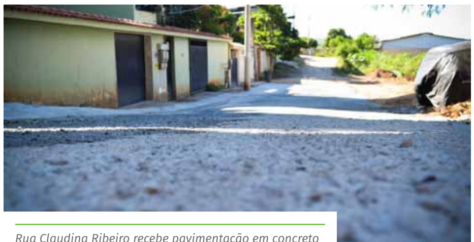
Rua Claudina Ribeiro recebe pavimentação em concreto