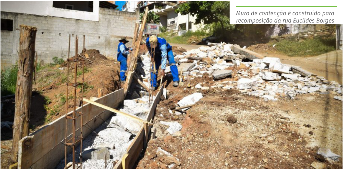
Muro de contenção é construído para recomposição da rua Euclides Borges

Já na rua Euclides Borges, a Semmat constrói um muro de contenção. A via vem sofrendo com um processo erosivo que danificou boa parte dela, a ponto de inviabilizar a passagem do transporte coletivo pelo local. Após a conclusão do muro, será feita a recomposição da rua e os ônibus poderão voltar a passar ali.