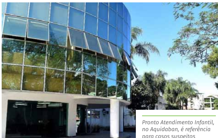
Pronto Atendimento Infantil, no Aquidaban, é referência para casos suspeitos

* Mães que amamentam e que estejam com diagnóstico de covid-19 não devem parar de fazê-lo. É importante que elas, nesses casos, tomem medidas para diminuir a possibilidade de transmissão, como o uso contínuo de máscara e a higienização das mãos com álcool em gel.