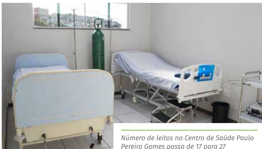
Número de leitos no Centro de Saúde Paulo Pereira Gomes passa de 17 para 27

O primeiro atendimento a pacientes com sintomas brandos da doença é feito nas unidades básicas de saúde, que também fazem testagem.