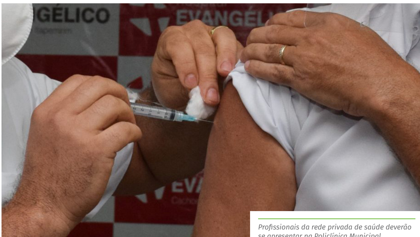
Profissionais da rede privada de saúde deverão se apresentar na Policlínica Municipal