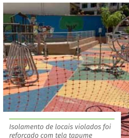
Isolamento de locais violados foi reforçado com tela tapume

contato são a página da Ouvidoria Geral ( cachoeiro.es.gov.br/ouvidoriageral ) e o aplicativo de celular “TodosJuntos”.