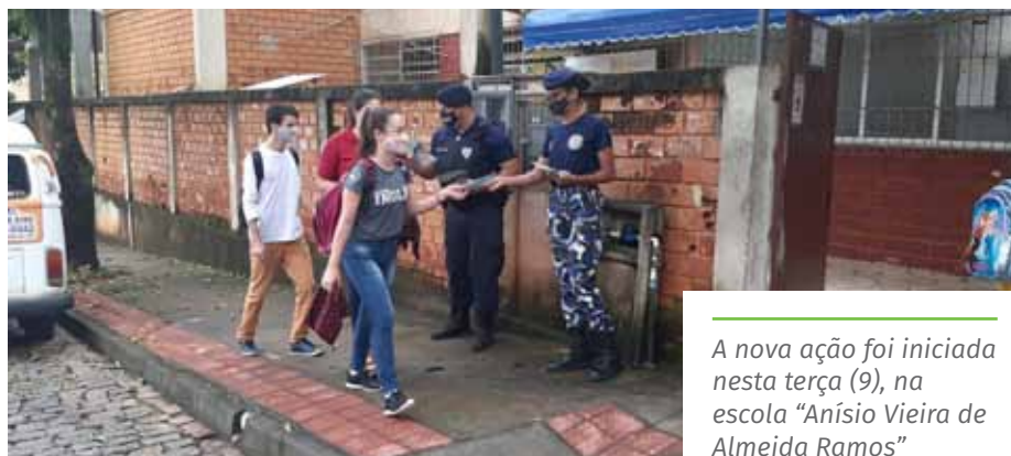
A nova ação foi iniciada nesta terça (9), na escola “Anísio Vieira de Almeida Ramos”

Outras atividades também fazem parte do trabalho da Rope, como palestras e interações lúdicas com os alunos de todas as etapas de ensino, com foco em temas como respeito e disciplina.