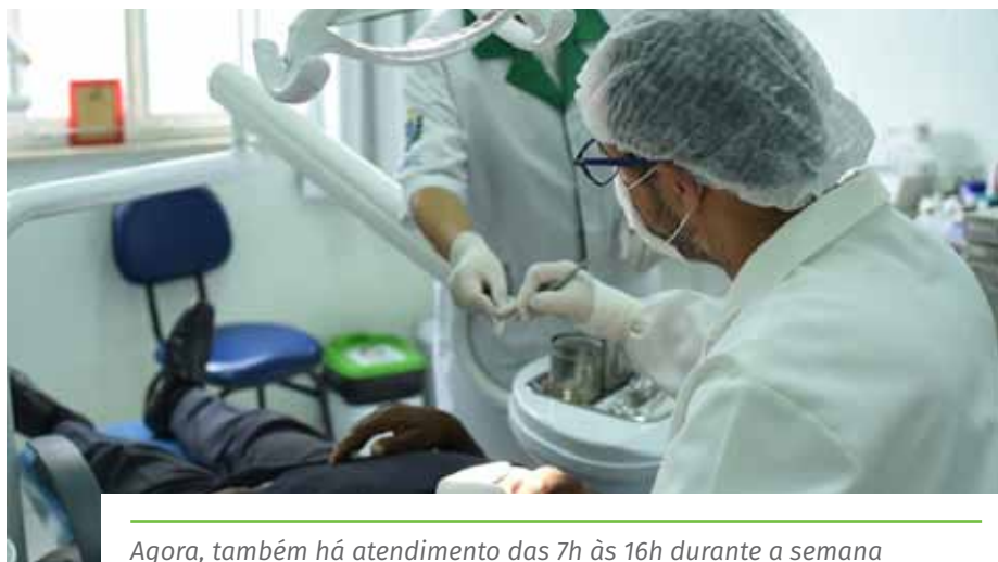
Agora, também há atendimento das 7h às 16h durante a semana