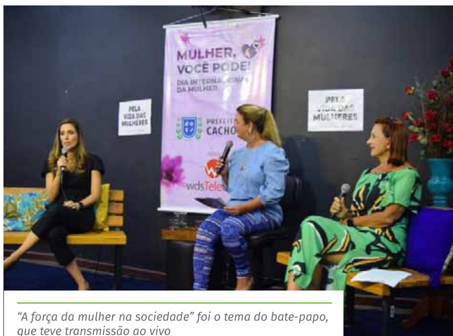
“A força da mulher na sociedade” foi o tema do bate-papo, que teve transmissão ao vivo