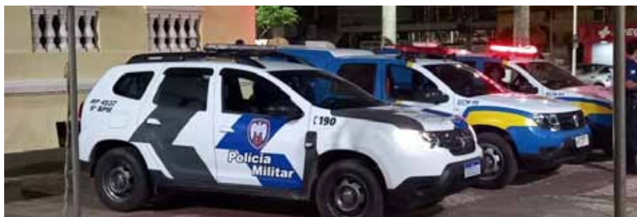
Ação conjunta envolveu Fiscalização, equipe de Trânsito, GCM, PM e Bombeiros

Denúncias de desrespeito às normas restritivas podem ser feitas junto ao Disk Aglomeração, que funciona 24 horas, pelo telefone 153, pela página www.cachoeiro.es.gov.br/ouvidoriageral ou pelo aplicativo de celular “Todos Juntos”.