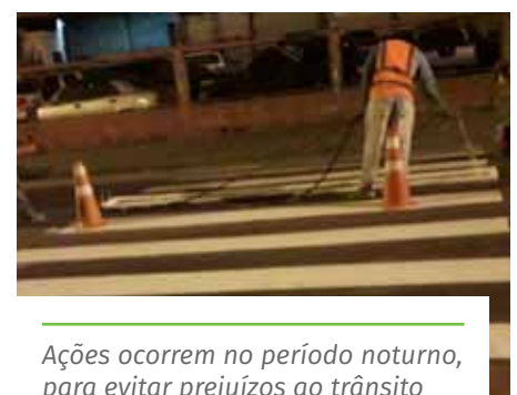
Ações ocorrem no período noturno, para evitar prejuízos ao trânsito