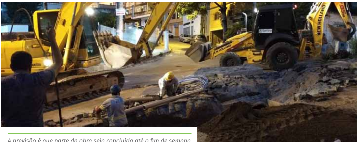
A previsão é que parte da obra seja concluída até o fim de semana

Desse modo, os condutores devem buscar rotas alternativas para acessar o local, como o tráfego pelas ruas José Bonifácio (Baiminas), Almerinda Amaral Rocha (Baiminas), Octávio Rocha (Bela Vista); ou saindo da Ponte do Arco, pelas ruas Amália Cordeiro e José Francisco dos Santos (Arariguaba). Já quem trafega do Centro, no sentido Arariguaba, pode pegar a rua Manoel Cardoso da Silva.