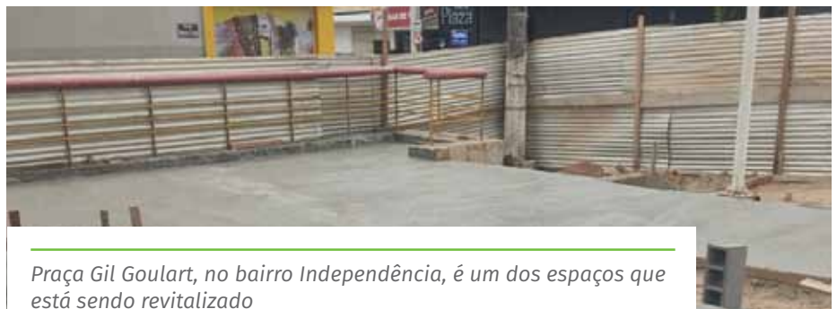
Praça Gil Goulart, no bairro Independência, é um dos espaços que está sendo revitalizado