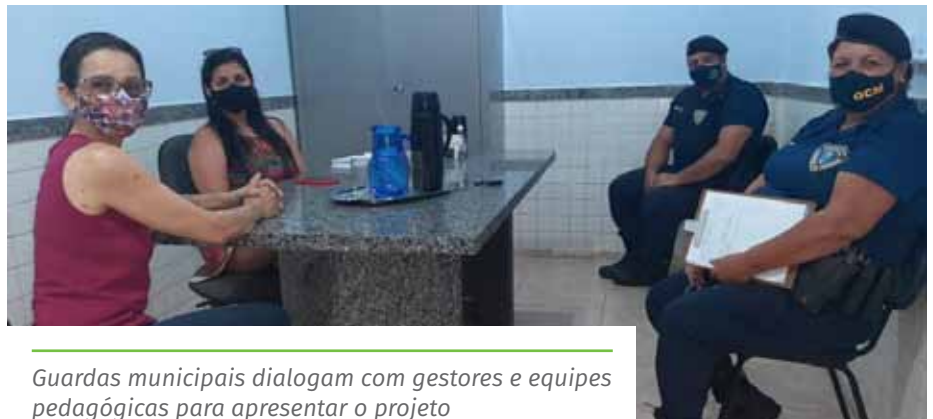
Guardas municipais dialogam com gestores e equipes pedagógicas para apresentar o projeto