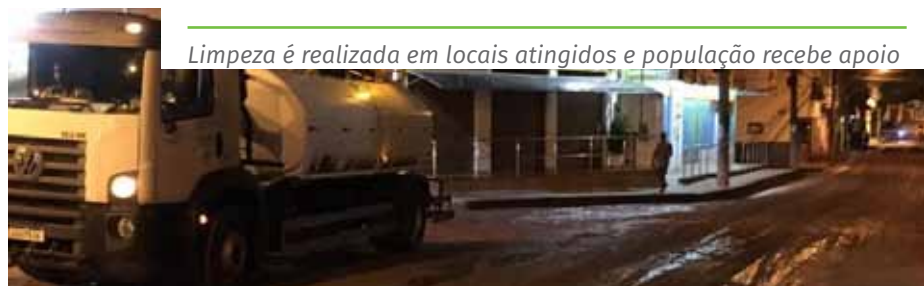
Limpeza é realizada em locais atingidos e população recebe apoio

Em Pacotuba, onde 15 famílias tiveram que deixar momentaneamente suas residências, no fim de semana, por conta do transbordamento do rio, a Semdes atendeu quatro famílias com entrega de cestas de alimento, na segunda-feira. Nesta terça, houve entrega de água mineral a seis famílias da comunidade de São João da Mata, no mesmo distrito, e mais duas famílias receberão colchões, cama e kits com jogos de cama.