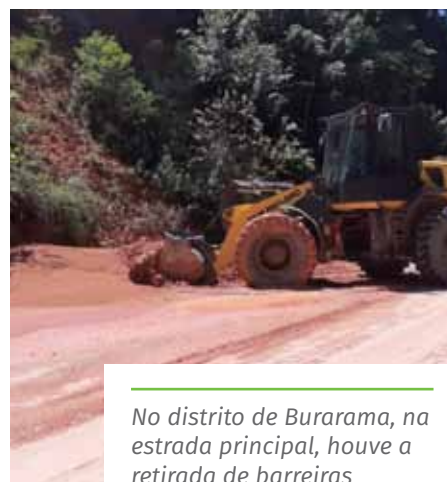
No distrito de Burarama, na estrada principal, houve a retirada de barreiras