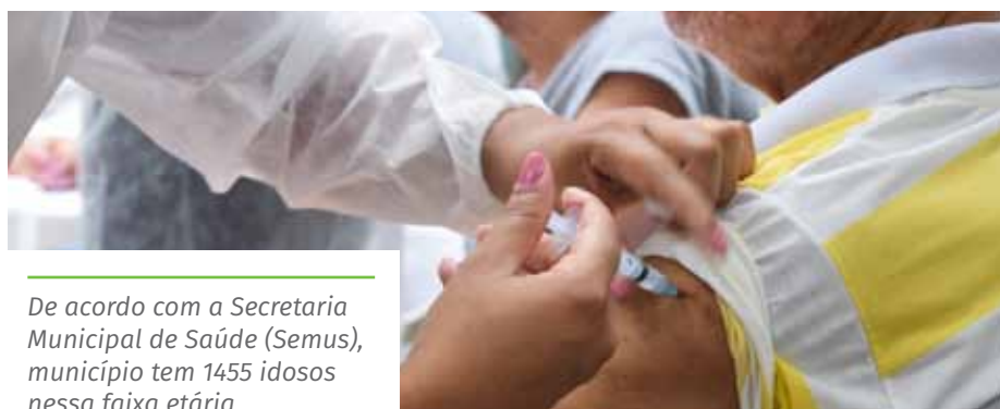
De acordo com a Secretaria Municipal de Saúde (Semus), município tem 1455 idosos nessa faixa etária

UBS Soturno UBS Burarama UBS Pacotuba UBS Córrego dos Monos UBS Itaoca UBS Conduru