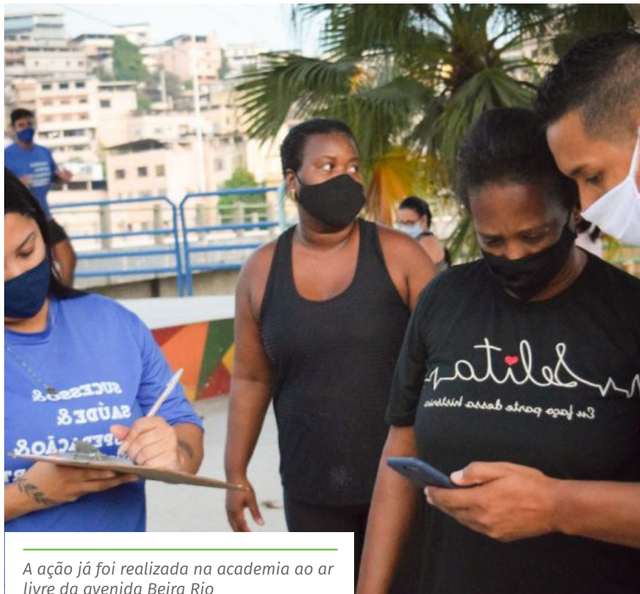
A ação já foi realizada na academia ao ar livre da avenida Beira Rio