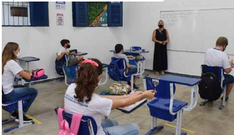
Turmas do 6º ao 9º ano do ensino fundamental foram as primeiras a voltar às unidades

“Estamos alegres com o retorno gradativo do ano letivo, de forma híbrida, buscando exercer todos os protocolos sanitários exigidos para ampliar a proteção aos nossos alunos e profissionais da educação. Trabalhando de maneira séria e com atenção às pessoas, vamos vencer mais esse desafio”, salienta o prefeito.