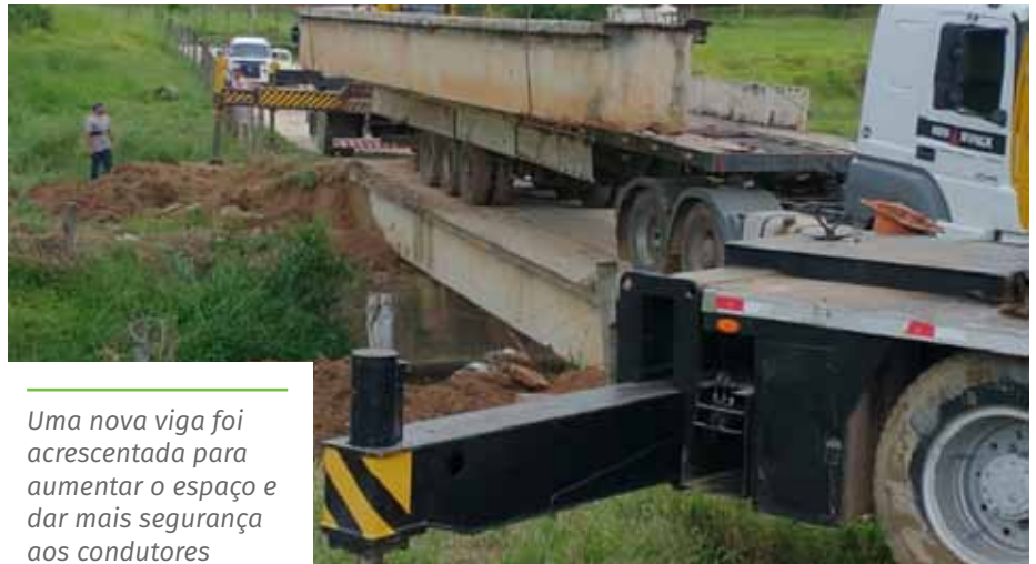
Uma nova viga foi acrescentada para aumentar o espaço e dar mais segurança aos condutores

A expectativa é de que as intervenções nas quatro pontes sejam concluídas até o fim de março.