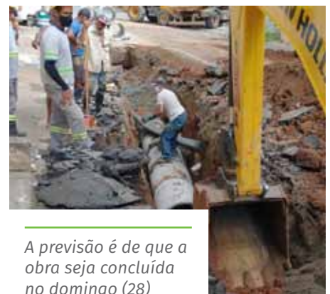
A previsão é de que a obra seja concluída no domingo (28)

Coelho até o acesso à rua Elizário Imperial. Por isso, os condutores devem buscar rotas alternativas para acessar esses locais.