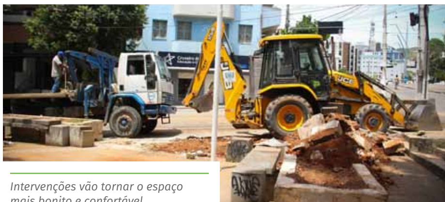
Intervenções vão tornar o espaço mais bonito e confortável

A Praça de Fátima, no Centro, também recebeu melhorias, bem como a praça Portinari, mais conhecida como “Praça dos Macacos”, localizada no bairro Gilberto Machado.