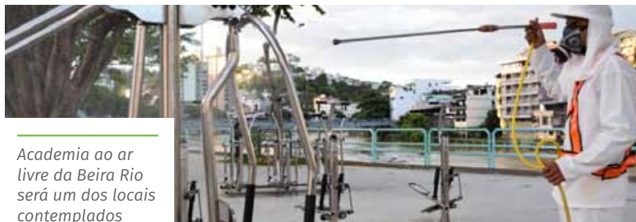
Academia ao ar livre da Beira Rio será um dos locais contemplados

As aplicações são realizadas com suporte de um pulverizador e de um caminhão-pipa, sempre a partir das 18h. O serviço é coordenado pelo Sistema de Comando de Operações (SCO) de enfrentamento da pandemia.