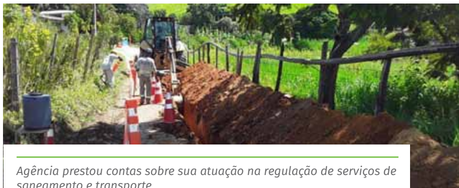
Agência prestou contas sobre sua atuação na regulação de serviços de saneamento e transporte

A população de Cachoeiro pode entrar em contato com a Ouvidoria da Agersa pelo telefone 0800 283 4048, por meio do aplicativo “Todos Juntos”, da Prefeitura, ou pelo site www.agersa.es.gov.br .