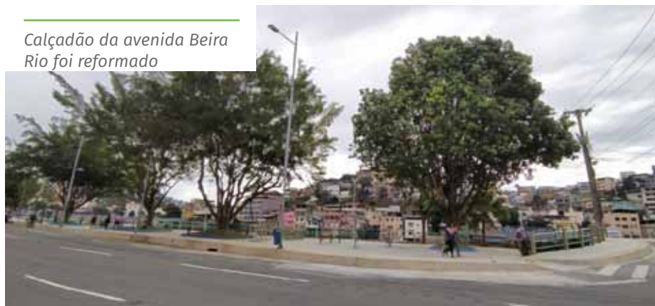
Calçadão da avenida Beira Rio foi reformado

A Prefeitura de Cachoeiro solicitou, ao Departamento de Edificações e Rodovias