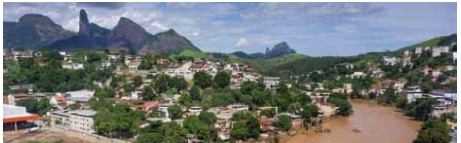
Prefeitura tem realizado diversas ações de recuperação após o desastre natural

Outra ação de destaque foi a ação contra hepatite A e outras doenças, tendo em vista a possibilidade de surgimento de doenças infecciosas em quem teve contato com água suja e lama.