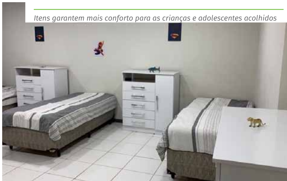
Itens garantem mais conforto para as crianças e adolescentes acolhidos

ganhou mais acessibilidade – por meio da instalação de rampas e de banheiros adaptados –; cobertura na área externa; uma pequena quadra esportiva; auditório; biblioteca; brinquedoteca; além de salas de enfermagem, de assistência social, de TV, de informática e de atendimento psicológico e pedagógico. Também foram contempladas as áreas de cozinha, refeitório e lavanderia. Todos os dormitórios, salas de tv e berçário têm ar-condicionado.