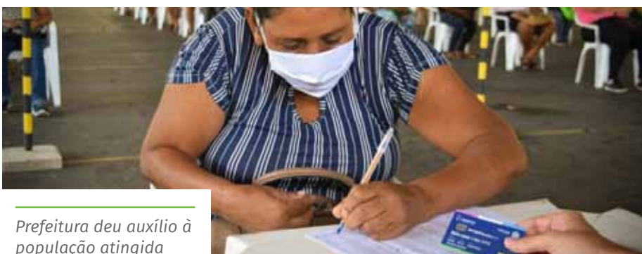
Prefeitura deu auxílio à população atingida