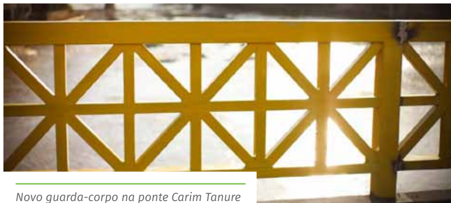
Novo guarda-corpo na ponte Carim Tanure