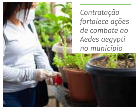
Contratação fortalece ações de combate ao Aedes aegypti no município

A Semus ressalta que os candidatos para as vagas de agentes comunitários de saúde, aprovados no mesmo processo seletivo, ainda serão convocados para contratação.