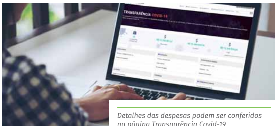
Detalhes das despesas podem ser conferidos na página Transparência Covid-19

“A situação de emergência e a queda na arrecadação por conta da diminuição das atividades econômicas têm sido um grande desafio para a administração municipal, mas estamos muito empenhados em buscar as soluções para os desafios que se apresentam e oferecer ao cachoeirense as melhores condições possíveis diante da realidade atual”, destaca o prefeito Víctor Coelho.