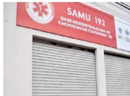
Base do Serviço de Atendimento Móvel de Urgência funcionará no Baiminas

O serviço funciona 24 horas, a partir de chamado telefônico, com prestação de orientações e envio de unidade móvel e equipe capacitada para realização do atendimento.