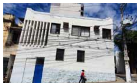
No local, são feitos atendimentos relacionados a programas e benefícios sociais

Mais informações sobre os benefícios podem ser conferidas por meio do número 3155- 5235 ou, ainda, no site www.cachoeiro.es.gov.br , na área de “Benefícios e Programas Sociais”, na página da Semdes.