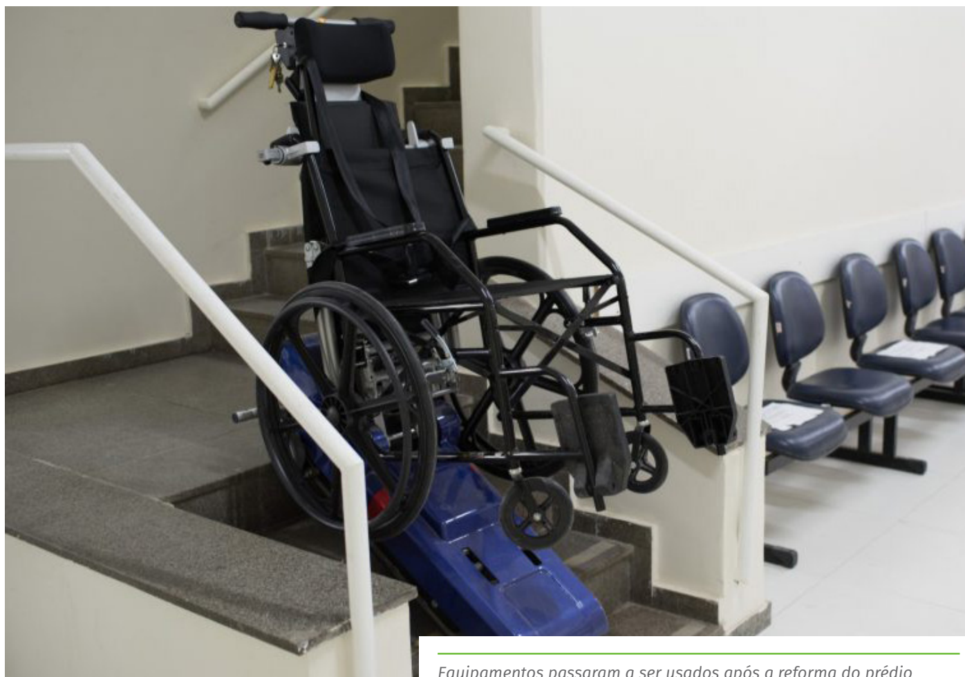
Equipamentos passaram a ser usados após a reforma do prédio

“Em Cachoeiro, apesar dos desafios, desejamos ter um olhar diferenciado para a mobilidade que a nossa cidade precisa, buscando garantir o direito de ir e vir de todos”, finaliza.