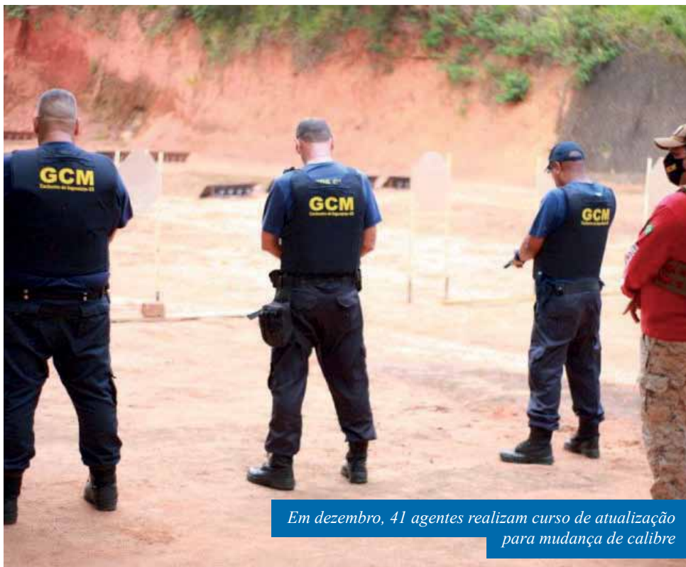
Em dezembro, 41 agentes realizam curso de atualização para mudança de calibre

Os agentes estão divididos em duas turmas,