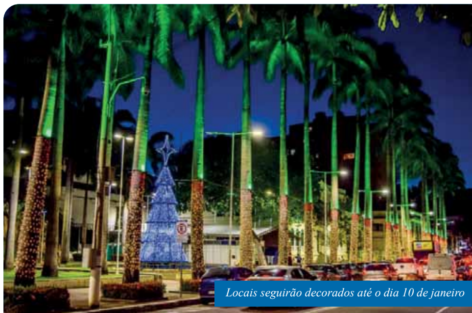
Locais seguirão decorados até o dia 10 de janeiro

“Apesar de todas as dificuldades que enfrentamos, optamos por fazer algo simples, mas que traga o espírito natalino e a esperança para as pessoas, para que a gente se lembre de que