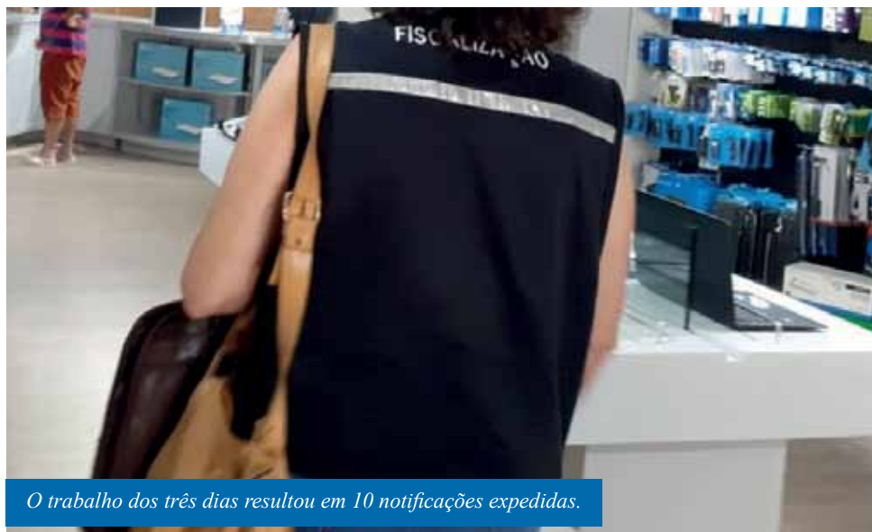
O trabalho dos três dias resultou em 10 notificações expedidas.

No último fim de semana, a equipe da Prefeitura de Cachoeiro responsável pela fiscalização de estabelecimentos para o cumprimento das normas de prevenção à Covid-19 realizou 139 vistorias. Os trabalhos contabilizados foram distribuídos entre sexta (11), sábado (12) e domingo (13), em 26 bairros e distritos diferentes.