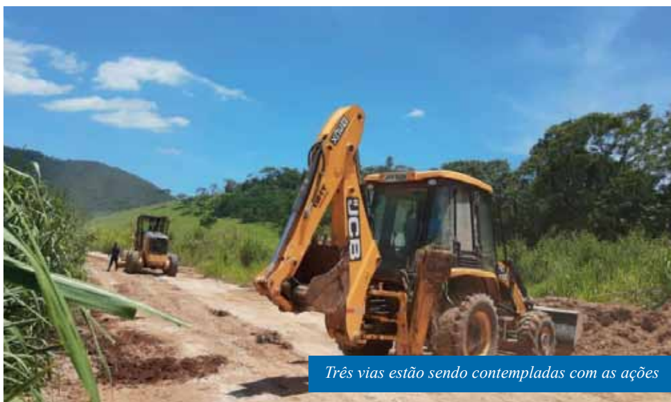
Três vias estão sendo contempladas com as ações

reconstrução de duas pontes do distrito de São Vicente destruídas pela enchente de janeiro. Na Ponte do Avelar, com 22 metros de comprimento, as cabeceiras das pontes já estão prontas. O próximo passo é fazer o aterro para colocar as vigas. Na ponte de Usina São Miguel, com 52 metros de comprimento, a construção das cabeceiras deverá ser concluída em breve.