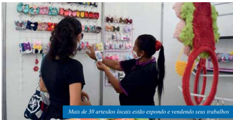
Mais de 30 artesãos locais estão expondo e vendendo seus trabalhos

O 1º Natal Arts na Praça, evento que reúne mais de 30 artesãos locais, expondo e vendendo seus trabalhos, já recebeu mais de 500 visitantes desde a semana passada, quando teve início. O evento acontece na praça Jerônimo Monteiro, em