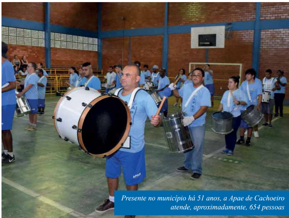
Presente no município há 51 anos, a Apae de Cachoeiro atende, aproximadamente, 654 pessoas

Nos últimos quatro anos, a instituição recebeu mais de R$ 3 milhões em recursos. A verba é proveniente das esferas públicas municipal (Prefeitura de Cachoeiro), estadual e federal. Os recursos ajudaram a melhorar a qualidade dos serviços e das instalações. Em 2019, por exemplo, com o edital de seleção do Fundo da Infância e Adolescência (FIA), a Apae de Cachoeiro conseguiu climatizar 10 salas de