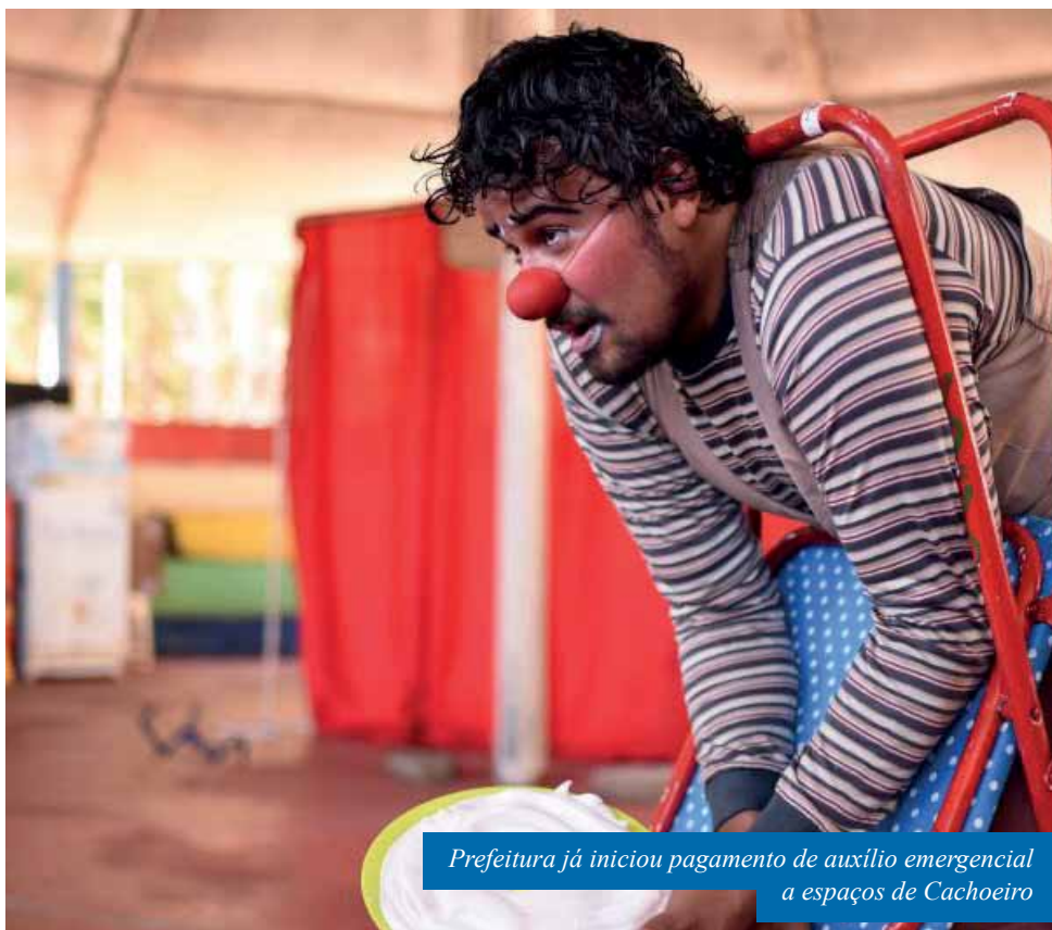
Prefeitura já iniciou pagamento de auxílio emergencial a espaços de Cachoeiro

A avaliação das propostas ficou a cargo da Comissão Municipal de Incentivo à Cultura (CMIC), formada por servidores municipais e representantes da sociedade civil, que levou em conta os critérios preestabelecidos no edital.