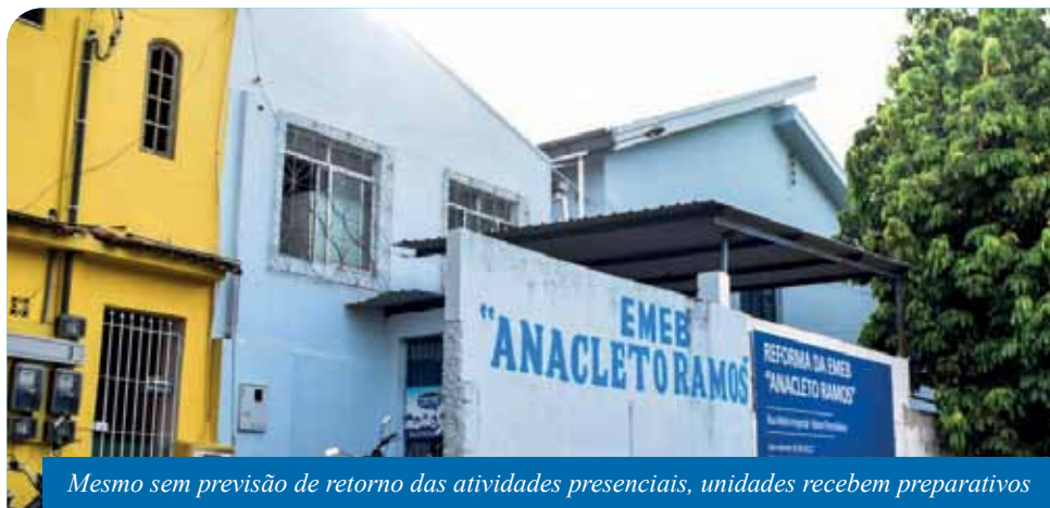
Mesmo sem previsão de retorno das atividades presenciais, unidades recebem preparativos

Embora o retorno às aulas presenciais ainda não tenha data definida, escolas municipais de Cachoeiro de Itapemirim estão recebendo melhorias para o novo ano letivo.