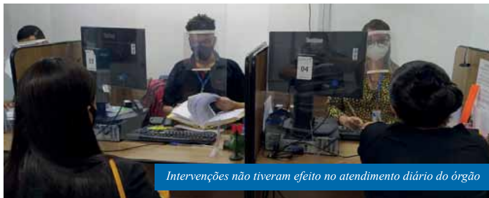
Intervenções não tiveram efeito no atendimento diário do órgão

A sede do Procon de Cachoeiro de Itapemirim, no bairro Maria Ortiz, está recebendo pintura nova. O serviço é feito aos fins de semana, permitindo o funcionamento do espaço de segunda à sexta, e promete deixar o ambiente com melhor aparência, melhorando toda a