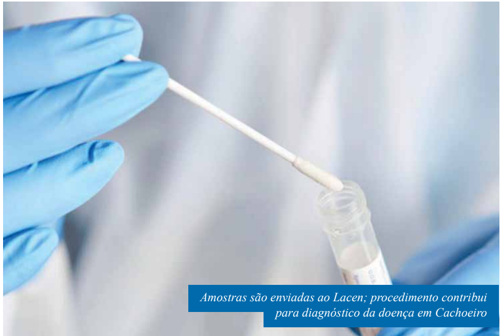
Amostras são enviadas ao Lacen; procedimento contribui para diagnóstico da doença em Cachoeiro