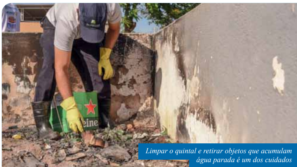
Limpar o quintal e retirar objetos que acumulam água parada é um dos cuidados

A Secretaria Municipal de Saúde (Semus) alerta a população para os cuidados com o mosquito Aedes aegypti , transmissor de doenças como dengue, zika e chikungunya.