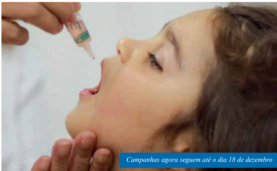
Campanhas agora seguem até o dia 18 de dezembro

As salas de vacinas de Cachoeiro, localizadas em Unidades Básicas de Saúde (UBS) e na Policlínica Municipal Bolívar de Abreu, atendem de segunda a sexta, das 8h às 16h. Unidades de saúde que não possuem sala de vacinas também ofertam o serviço, mas apenas uma vez por semana, das 9h às 15h. São elas: Parque Laranjeiras e Agostinho Simonato, às terças-feiras; Nossa Senhora da Penha, às quartas; Gironda, às quintas (de 9h às 12h) e Vila Rica, Agostinho Simonato e Recanto, às sextas-feiras.