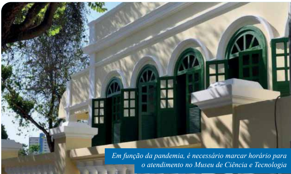
Em função da pandemia, é necessário marcar horário para o atendimento no Museu de Ciência e Tecnologia

A nova ferramenta permite um armazenamento mais seguro e completo dos dados dos