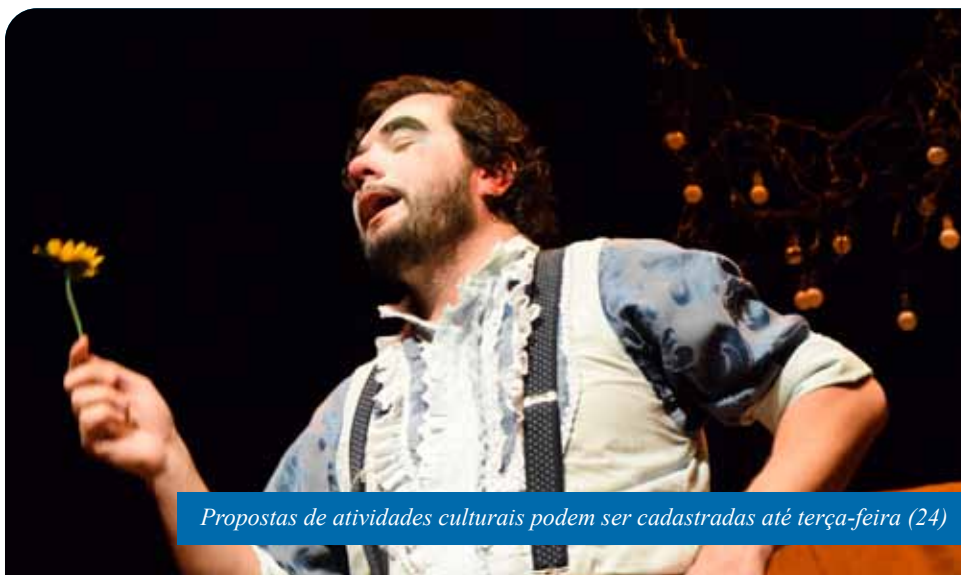
Propostas de atividades culturais podem ser cadastradas até terça-feira (24)

As inscrições que atenderem a todas as exigências previstas no regulamento serão analisadas pela Comissão de Incentivo à Cultura – formada por integrantes do Conselho Municipal de Política Cultural (CMPCCI) e da Secretaria Municipal de Cultura e Turismo (Semcult) – entre os dias 25 e 30 deste mês.