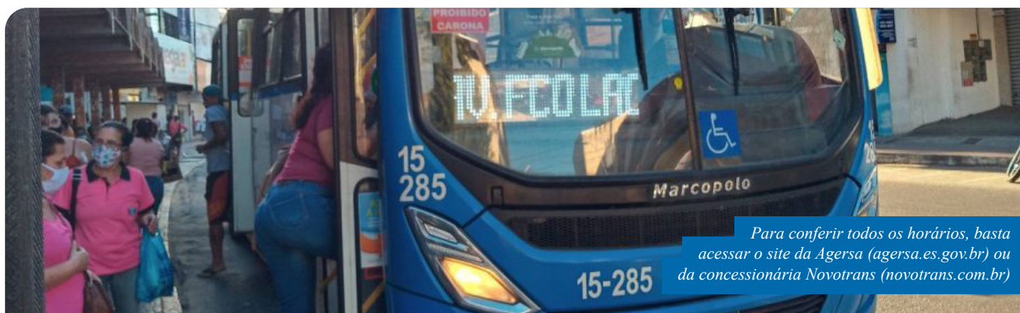
Para conferir todos os horários, basta acessar o site da Agersa ( agersa.es.gov.br ) ou da concessionária Novotrans ( novotrans.com.br )

Para conferir todos os horários, basta acessar o site da Agersa ( agersa.es.gov.br ) ou da concessionária Novotrans ( novotrans.com.br ).