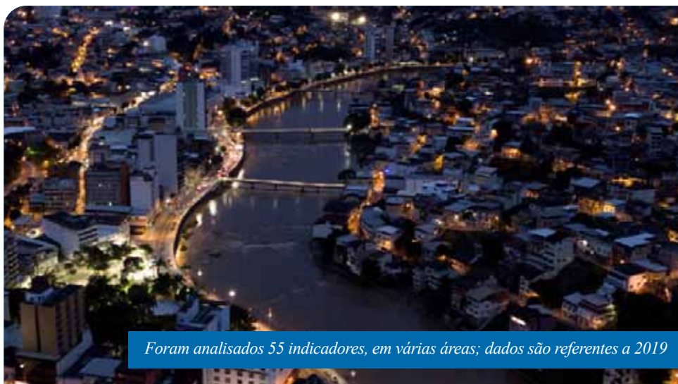
Foram analisados 55 indicadores, em várias áreas; dados são referentes a 2019

De acordo com a publicação, a “definição de competitividade sob a ótica da gestão pública diz respeito à capacidade de planejamento, articulação e execução por parte do poder público, em seus territórios de responsabilidade, na promoção do bem-estar social, atendimento às necessidades da população e geração de um ambiente de negócios favorável”.