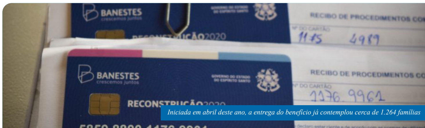
Iniciada em abril deste ano, a entrega do benefício já contemplou cerca de 1.264 famílias

Trezentos e quarenta e nove famílias ainda receberão o auxílio, que pode ser usado para compra de material de construção para reformas, eletrodomésticos, móveis ou outros utensílios que foram perdidos ou danificados pela chuva. O beneficiário tem o prazo de seis meses, a contar da data de retirada do cartão, para utilizar o valor liberado.