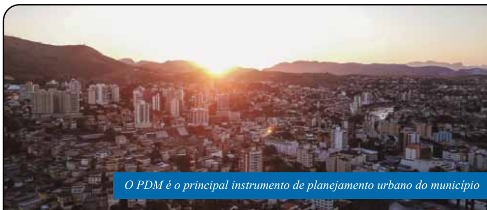
O PDM é o principal instrumento de planejamento urbano do município

Para participar da transmissão audiovisual, pela internet, será necessário acessar o site da Prefeitura de Cachoeiro ( cachoeiro.es.gov.br ). O link da audiência será disponibilizado no Espaço Plano Diretor, que pode ser acessado na página