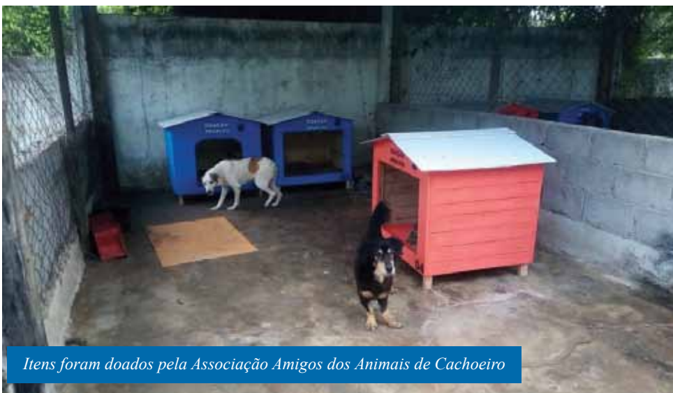
Itens foram doados pela Associação Amigos dos Animais de Cachoeiro

Neste mês, a Unidade de Vigilância de Zoonoses (UVZ), da Secretaria Municipal de Saúde (Semus) de Cachoeiro, recebeu doações de casinhas e tablados para os cães que ficam alojados no local. A ação foi realizada pela Associação Amigos dos Animais de Cachoeiro de Itapemirim (Amakachu).