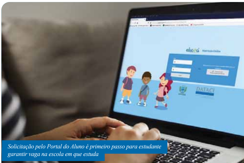
Solicitação pelo Portal do Aluno é primeiro passo para estudante garantir vaga na escola em que estuda

“Estamos organizados para iniciar todo processo de rematrícula e matrículas novas, seguindo os procedimentos preventivos relativos à Covid-19. Caso alguma família não tenha acesso à internet, pode entrar em contato com o gestor escolar ou ir até a escola, que os servidores auxiliarão no acesso ao sistema da rematrícula. Daremos todo o suporte”, afirma a secretária