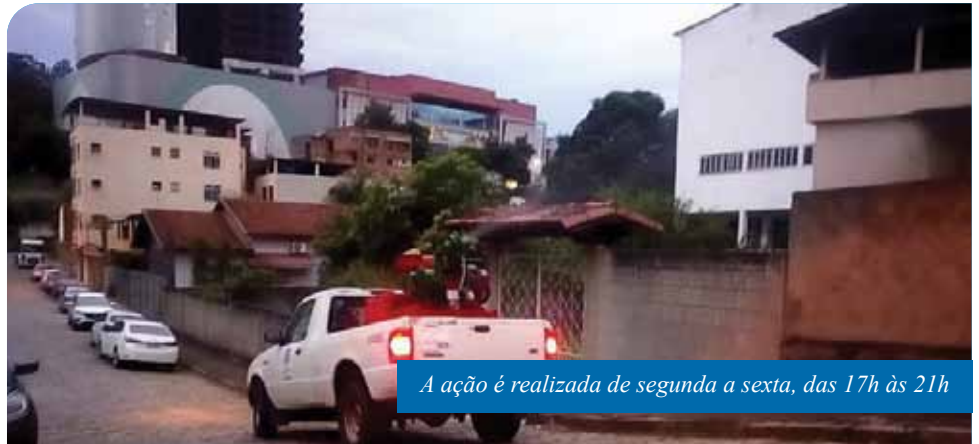
A ação é realizada de segunda a sexta, das 17h às 21h

Além disso, agentes de combate a endemias continuam realizando o serviço de visita domiciliar, no entanto, devido à pandemia de Covid-19, a orientação é que o trabalho seja peridomiciliar, ou seja, com visita somente