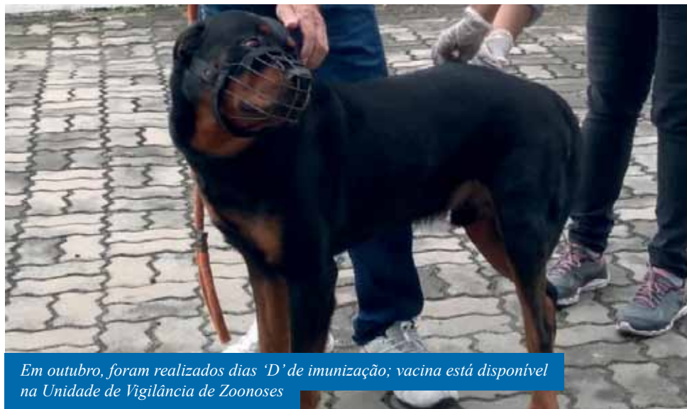
Em outubro, foram realizados dias 'D' de imunização; vacina está disponível na Unidade de Vigilância de Zoonoses

A campanha de vacinação antirrábica, realizada pela Secretaria Municipal de Saúde de Cachoeiro, já alcançou cerca de 28 mil cães e gatos.