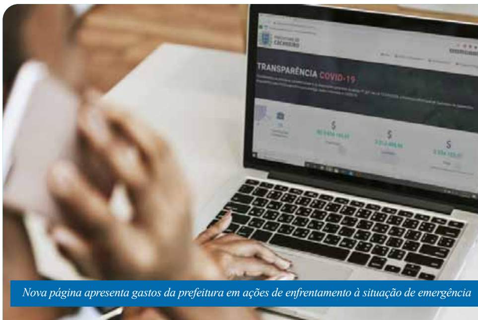
Nova página apresenta gastos da prefeitura em ações de enfrentamento à situação de emergência

mecanismo de controle social das ações do poder público durante a pandemia, dando ampla transparência às informações e favorecendo o