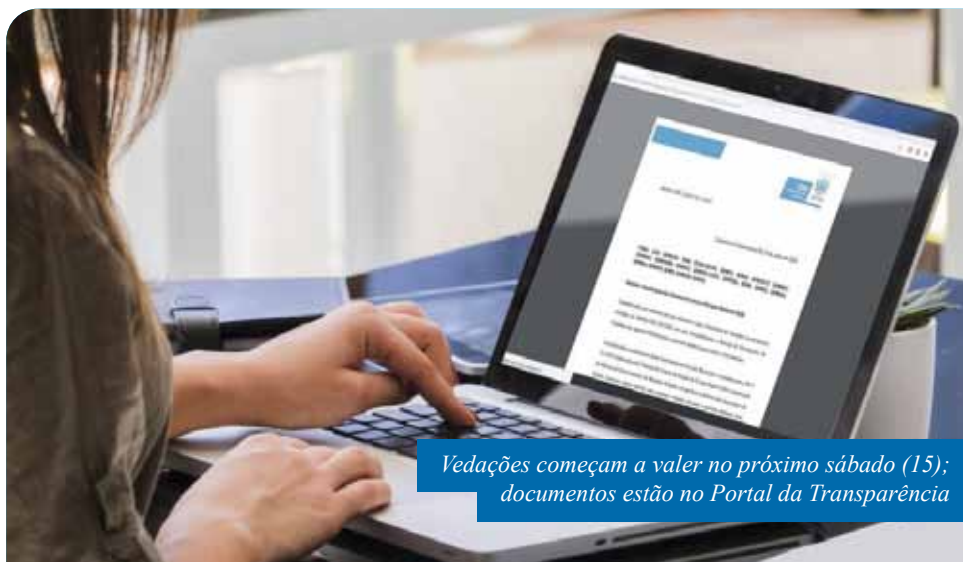
Vedações começam a valer no próximo sábado (15); documentos estão no Portal da Transparência