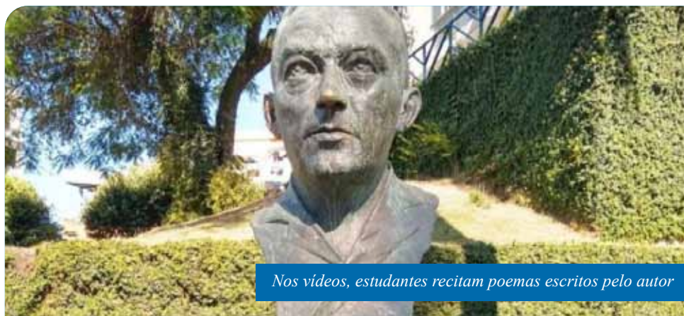
Nos vídeos, estudantes recitam poemas escritos pelo autor

de Cachoeiro. Estudou no Rio de Janeiro e em Belo Horizonte, cidade onde atuou em jornais e publicou poemas com influência do modernismo. Voltou para a cidade natal, em 1932, onde foi jogador do Estrela do Norte e redator-chefe do Correio do Sul, que usou para impulsionar movimentos cívicos, como a criação do Dia de Cachoeiro. “Lirismo perdido”, “Cidade do interior” e “Poesias e prosa” são algumas de suas principais obras.