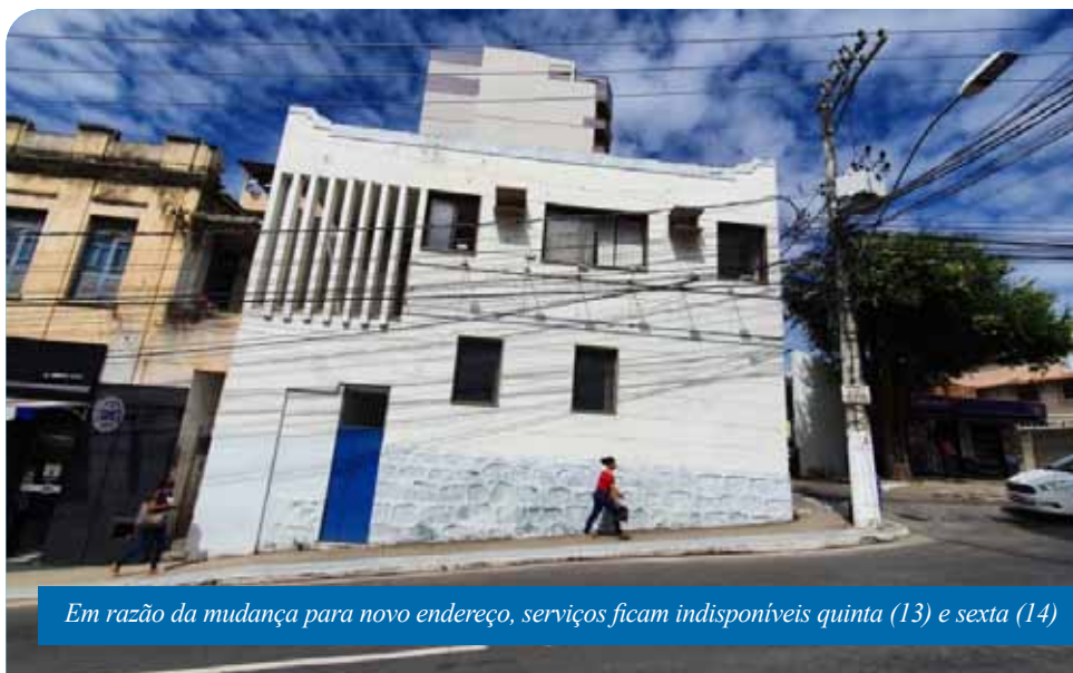
Em razão da mudança para novo endereço, serviços ficam indisponíveis quinta (13) e sexta (14)

Até esta quarta (12), a Central do CadÚnico e Bolsa Família funcionam na rua 25 de Março, nº