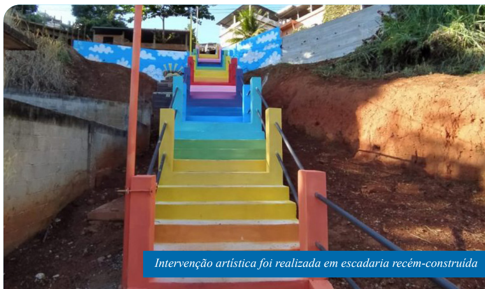
Intervenção artística foi realizada em escadaria recém-construída

As melhorias no Basileia não param por aí. Na escadaria recém-construída, pela Prefeitura, para ligar as ruas Professor Pedro Estellita Herkenhoff e José Antônio Campanharo, a Secretaria Municipal de Serviços Urbanos (Semsur) realizou uma intervenção artística que garantiu um colorido