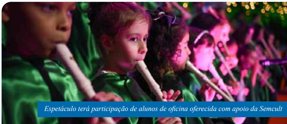
Espectáculo terá participação de alunos de oficina oferecida com apoio da Semcult

Na ocasião, os pequenos artistas abrilhantarão o show com uma apresentação em vídeo. Quem quiser conferir a atração, basta acessar as redes sociais do projeto Casa Verde: no Instagram (@casaverdeprojeto), Facebook (Projeto Casa Verde) ou YouTube (Orquestras Casa Verde).