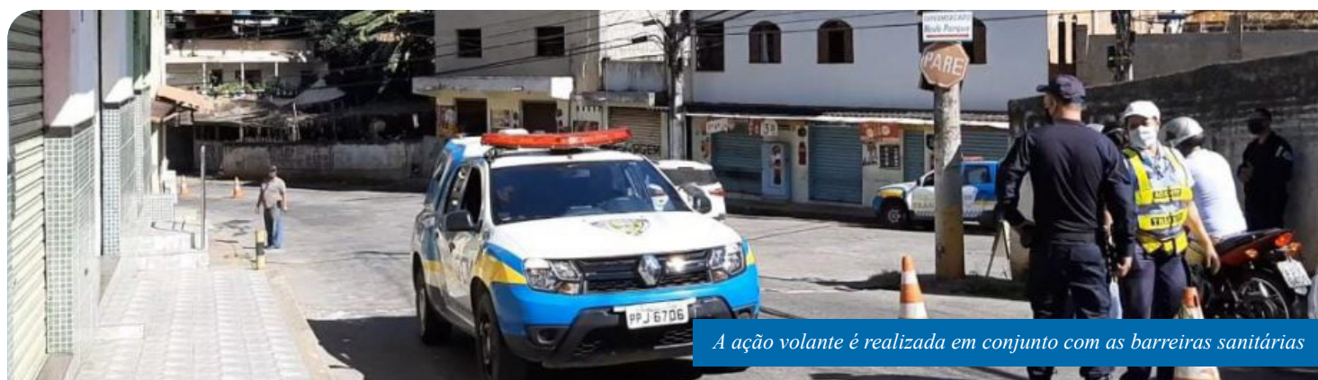
A ação volante é realizada em conjunto com as barreiras sanitárias