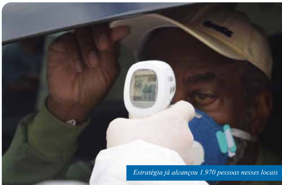
Estratégia já alcançou 1.970 pessoas nesses locais

Os bairros escolhidos para receber as barreiras estão entre os que têm mais casos confirmados da doença. “Nossa estratégia é informar as pessoas