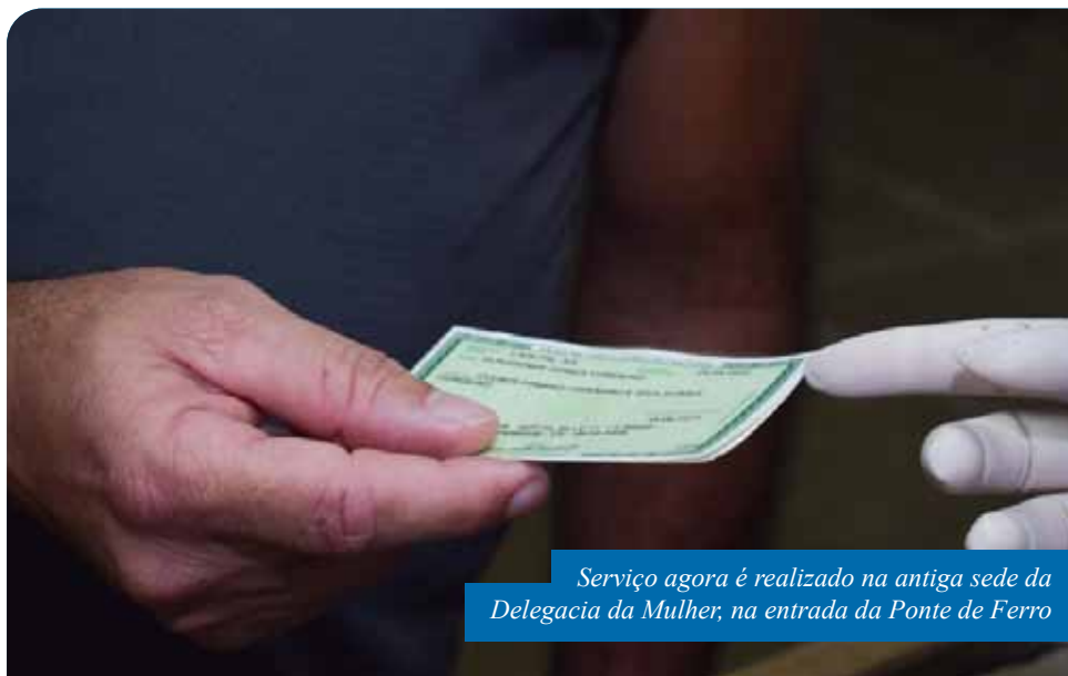
Serviço agora é realizado na antiga sede da Delegacia da Mulher, na entrada da Ponte de Ferro

Assim como nos demais estabelecimentos do município, não é permitido entrar sem máscara no Posto de Identificação. Também está proibida a entrada de menores de 10 anos e é recomendado que os cidadãos se dirijam até o local sem acompanhantes, se não houver necessidade.