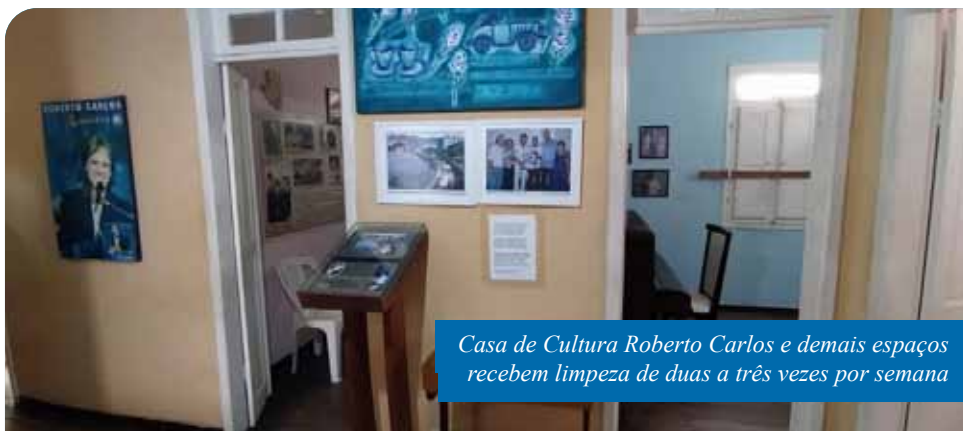
Casa de Cultura Roberto Carlos e demais espaços recebem limpeza de duas a três vezes por semana

Severamente afetada pela enchente de janeiro, a Biblioteca Pública Municipal Major Walter dos Santos Paiva está recompondo o seu acervo perdido. O Teatro Municipal Rubem Braga, outro espaço muito atingido pelo desastre natural e que precisará ser restaurado, também recebe