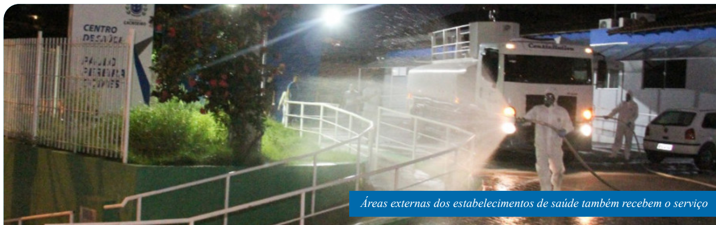
Áreas externas dos estabelecimentos de saúde também recebem o serviço

As aplicações são realizadas com suporte de um pulverizador e de um caminhão-pipa e são coordenadas pela Secretaria Municipal de Transportes (Semtra), sempre a partir das 18h.