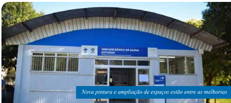
Nova pintura e ampliação de espaços estão entre as melhorias

A UBS de Soturno também está melhor equipada: ganhou aparelhos de ar condicionado nos consultórios e novos bebedouros; computador; rede de internet e macas. Para a área de