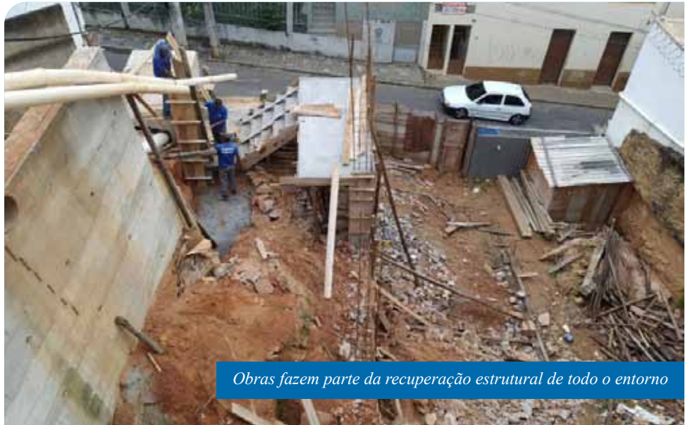
Obras fazem parte da recuperação estrutural de todo o entorno

“O trabalho nas ruas Alziro Viana e Vicente Campos tem demandado um esforço maior. Atuamos com recursos próprios, no início, para