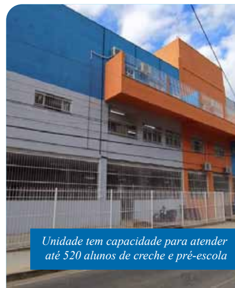
Unidade tem capacidade para atender até 520 alunos de creche e pré-escola

Além disso, foi feita uma obra de drenagem