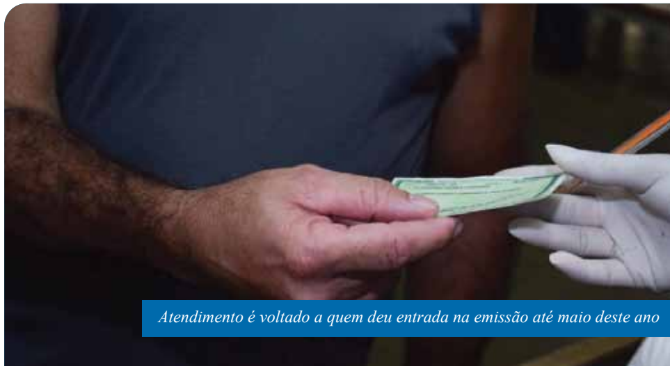
Atendimento é voltado a quem deu entrada na emissão até maio deste ano

“A identidade é um documento muito importante, todos precisam ter. Eu tinha perdido a minha e agora estou aliviada porque consegui meu