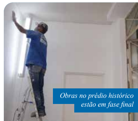
Obras no prédio histórico estão em fase final

Também podem ser acessados, sem agendamento prévio, das 7h às 16h, os serviços de entrega de resultados de raio x, confecção de cartão do SUS e exames de dengue e de chikungunya.