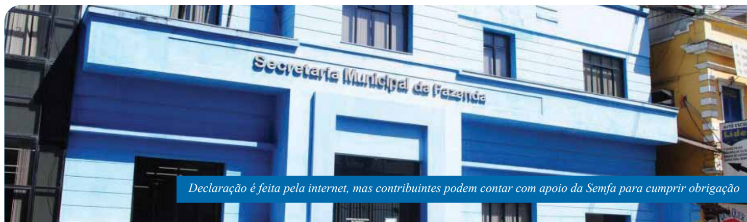
Declaração é feita pela internet, mas contribuintes podem contar com apoio da Semfa para cumprir obrigação

A Secretaria Municipal de Fazenda (Semfa) de Cachoeiro também está à disposição para prestar auxílio aos contribuintes do município. O atendimento é feito na rua 25 de Março, Centro, em frente ao Shopping Cachoeiro. O telefone de contato é o (28) 3155-5230.