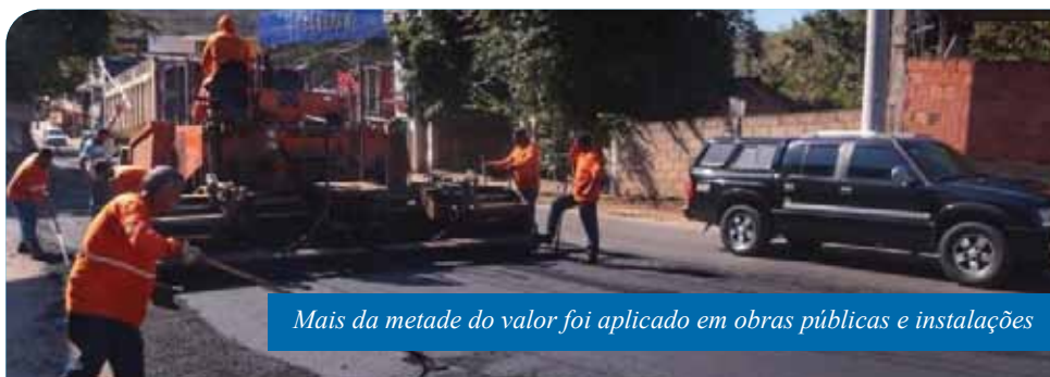
Mais da metade do valor foi aplicado em obras públicas e instalações