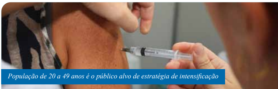
População de 20 a 49 anos é o público alvo de estratégia de intensificação

“A dose extra de sarampo, por meio da vacina tríplice viral ou dupla viral, para a população de 20 a 49 anos, melhora a cobertura vacinal na faixa etária adulta, conferindo maior proteção a esse público,