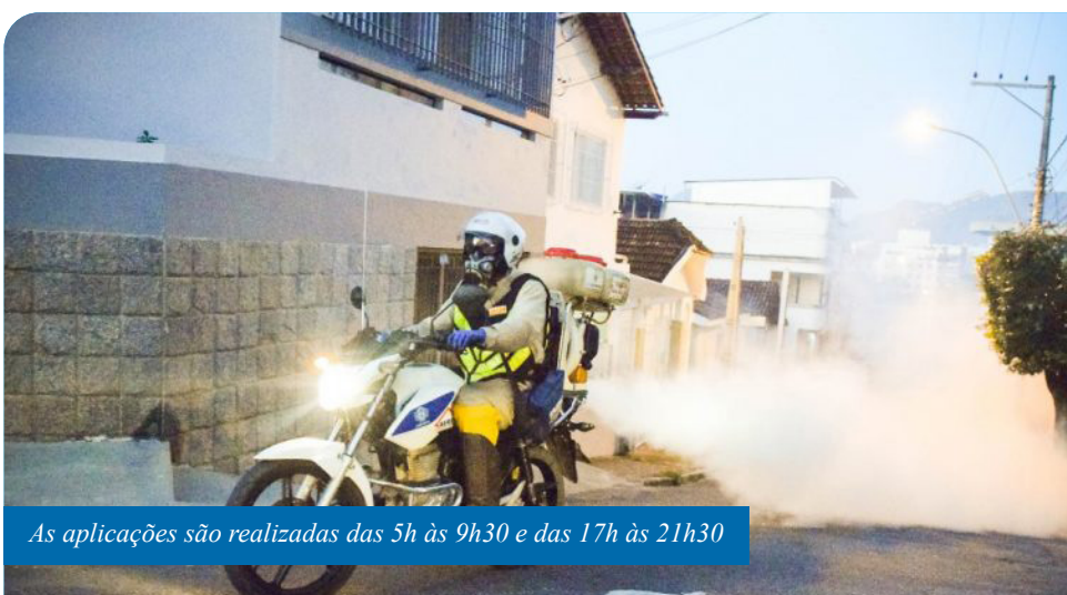
As aplicações são realizadas das 5h às 9h30 e das 17h às 21h30

Quartas-feiras: Alto Amarelo, Amaral, Amarelo, Arariguaba, Baiminas, Basileia, Bela Vista, Campo Leopoldina, Centro, Costa e Silva,